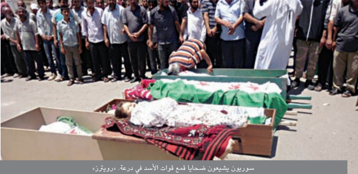
سوريون يشيعون ضحايا قمع قوات الأسد في درعة.

وغربية في الأيام الأخيرة» معتبرة أن ذلك «شكل حالة احباط لدى معارضة الخارج». وقال وزير الخارجية الفرنسي لوران فابوس إن النص يلمح إلى ضرورة تنحي الأسد. واعتبر وزير الخارجية الألماني غيدو فسترفيلي أن لقاء جنيف بشكل «دليلا واضحا» على الرغبة في التوصل على المستوى الدولي إلى حل سياسي للنزاع. ومن جانبها، اعتبرت إيران أسس أن الاجتماع «لم يكن ناجحا» خصوصا بسبب غياب طهران.