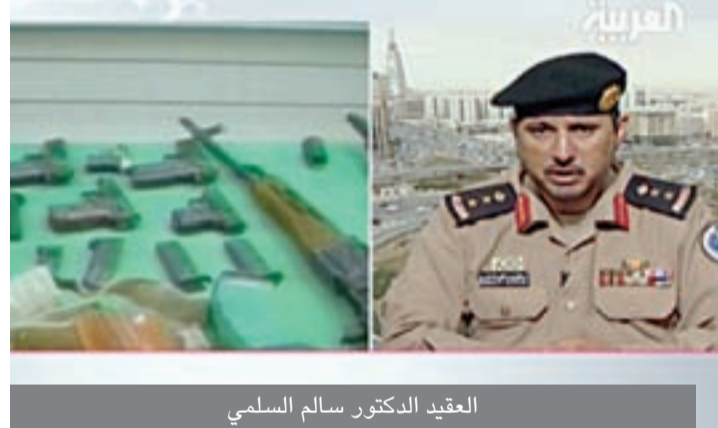
العقيد الدكتور سالم السلمي

وفي نفس الوقت، قال مصدر في الخارجية الامريكية «عندما سمعنا ان الرئيس المصري الجديد تعهد بإطلاق سراح الشيخ الكفيف، قلنا ان الرئيس المصري الجديد، الذي درس في الولايات المتحدة، وحصل على دكتوراه من جامعة أمريكية، ربما يجب أن يعرف أن القضاء الأمريكي مستقل عن الحكومة الأمريكية».