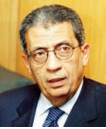
● عمرو موسى