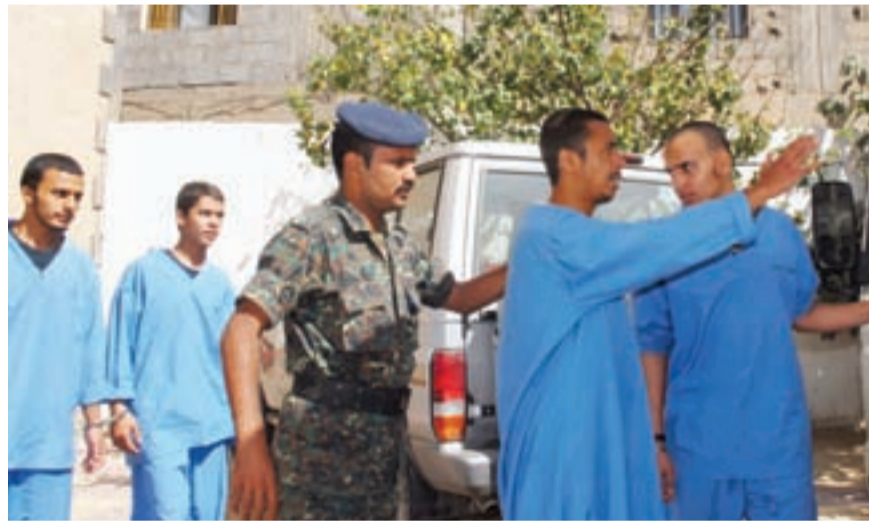
● عناصر القاعدة خلال نقلهم بعد تأجيل محاكمتهم في صنعاء أمس.

كما يشير البيان الى استمرار نشاط «منظمات ارهابية في اليمن بما في ذلك تنظيم قاعدة الجهاد في جزيرة العرب»، وكانت استراليا دعت الجمعة رعاياها في اليمن الى مغادرته وحذرت مواطنيها من مغبة السفر اليه، مؤكدة ان خطر وقوع اعتداء ارهابي في هذا البلد «مرتفع جدا».