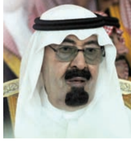
● الملك عبدالله بن عبد العزيز

الرياض - دبا: وصل إلى الرياض مساء أمس الأحد الرئيس السوري بشار الأسد في زيارة إلى المملكة تستغرق يوماً واحداً. وكان في استقبال الأسد في المطار العاهل السعودي الملك عبدالله بن عبدالعزيز في ثاني زيارة للرئيس السوري للرياض بعد توتر العلاقات بين البلدين عقب اغتيال رئيس الوزراء اللبناني الأسبق رفيق الحريري في الرابع عشر من شهر فبراير عام 2005.