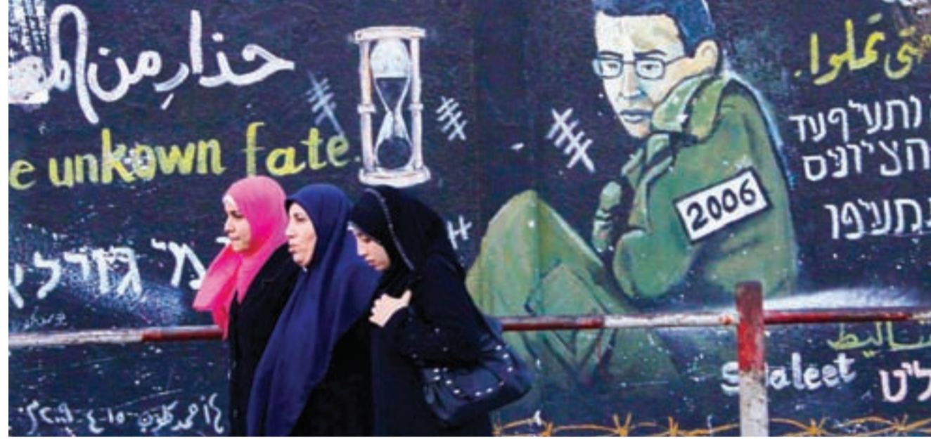
● فلسطينيات بجانب ملصق جداري للجندي شاليط في غزة أمس.

وكانت صحيفة يديعوت احرونوت الإسرائيلية افادت أمس ان الوسيط الالمانى توجه قبل اسبوعين الى قطاع غزة حيث التقى مسؤولين في حماس.