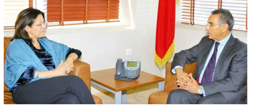
لقاء الوزيرة بالسفير السعودي.

أكد سفير خادم الحرمين الشريفين لدى مملكة البحرين، الدكتور عبدالحسن بن فهد المارك أن المواطنين السعوديين في البحرين من مقيمين وطلبة وزائرين وسواح في أيد أمينة ويشعرون بأنهم في بلداهم الثاني بين أهلهم وإخوانهم، مقدراً عدد السعوديين الداخلين للبحرين بما بين ٢٥ و٣٠ ألف زائر يوميا. وشكر السفير السعودي في تصريحات صحفية، على هامش حضوره حفل فعاليات فن الإبداع السعودي البحريني مساء أمس بالمانامة، البحرين بقيادة وحكومة وشعباً على حسن الضيافة وعلى جميع التسهيلات المقدمة للمواطنين السعوديين، مؤكداً مدى ترسخ عوامل الأمن والاستقرار في