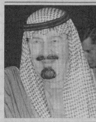
الملك عبدالله بن عبدالعزيز

على هذه الفتنة التي لا مصلحة لاحد في شعلتها لان ضررها سيصيب الجميع وان يفرق بين هذا وذاك. من ناحية ثانية، قال مرجع الاسلامي اللبناني العلامة محمد حسين فضل الله امس ان اخطة الاسلام واي مبادرة خارجية لساعدة لبنان لن تفي الا لو يتحقق الوفاق في حكومة وحدة وطنية تكون في الساحة للحول. وبعد فضل الله في خطبة صلاة الجمعة على منبر مسجد الامامين الحسين في ضاحية بيروت الخيرية التي تواجه كل الدعوات التي تصمد الى التارة العنصرية العربية التي تسفل الحساس الديني الذهبي من اجل تحفيز السني الشيعي والشيعة بالسني. وعاب فضل الله باعطاء فرصة للمبادرة العربية، محذرا من الذين يحاولون التارة العنصرية والعصبيات التي تعطل ابي الوفاق وتسقط اي مبادرة، ان المطلوب هو