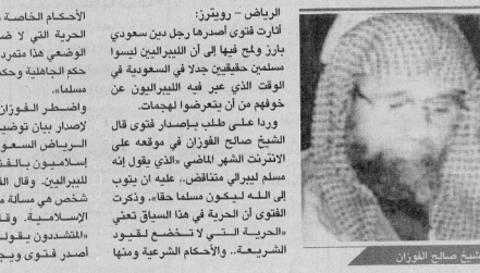
الشيخ صالح الفوزان

الأحكام الخاصة بالراء.. فالذي يريد الحرية التي لا ضابط لها إلا القانون الوضعي هذا مترد على شرع الله الذي حكم الجاهلية وحكم الطغراف لا يكون مسلما». واضطرب الفوزان في الفتوى الأخيرة لإصدار بيان توضحه نشرته صحيفة الرياض السعودية بعد أن أشار لليبراليين «الفتوى بوصفها تكفيرا لشخص هي مسألة منسقة في الشريعة الإسلامية. وقال حمزة الزمزمي «المتشددون يقولون.. أن الفوزان أصدر فتوى ويوجد أن تحرك تبعاً