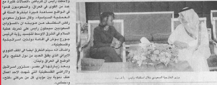
وزير الخارجية خلال استقباله رايس

عواصم - وكالات: يعقد اليوم الثلاثاء بقصر التحرير التابع لوزارة الخارجية اجتماع مشترك لوزراء خارجية كل من مصر ودول مجلس التعاون الخليجي والأردن والولايات المتحدة الأمريكية والأمن العام لدول مجلس التعاون الخليجي. ويعد هذا الاجتماع هو الثاني الذي يعقد على هذا المستوى، حيث سبق وأن عقد الاجتماع الأول في نيويورك في شهر سبتمبر الماضي على هامش أعمال الجمعية العامة للأمم المتحدة. وقد وصلت وزيرة الخارجية الأمريكية كوندوليزا رايس مساء أمس إلى السعودية، لطلب مساعدة السعوديين من أجل «استقرار» الوضع في العراق وليدنا، وهي لحظة الأولى في إطار جولتها بالشرق الأوسط، وأجرت محادثات مع العامل السعودي الملك عبدالله بن عبد العزيز، ونظيرها