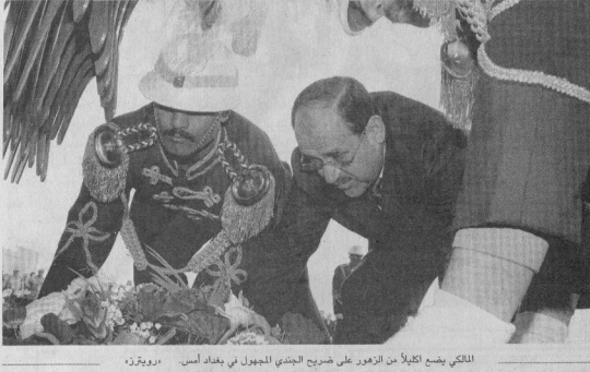
المالكي يرضع الأطفال من الزهور على ضريح الجندي المجهول في بغداد أمس -.

تفتقد الخطة الامنية حرصا على المصالح العليا للبلاد. وقال شتاينماير لصحيفة بيلد ام زوتاج الألمانية الأسبوعية هناك بالتأكيد خطورة من ان يساعد هذا الإعدام الذي جرى في علة إسلامية وصار أداة تداولها الإعلام والخطا واسع في ان يتحول صدام حسين إلى شهيد بالنسبة لانصاره.