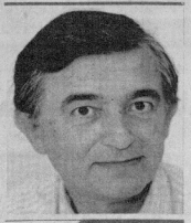
فيليب دوست بلازي

دوست بلازي أمس في السعودية لإجراء محادثات تتحور خصوصا حول لبنان حسب ما أفاد مصدر بلومبي فرسي فضل عدم الكشف عن اسمه. والذي أضاف ان الوزير الفرنسي سيلتقي نظيره السعودي الاير سعودي الصمبل خلال زيارته القصيرة إلى الرياض.