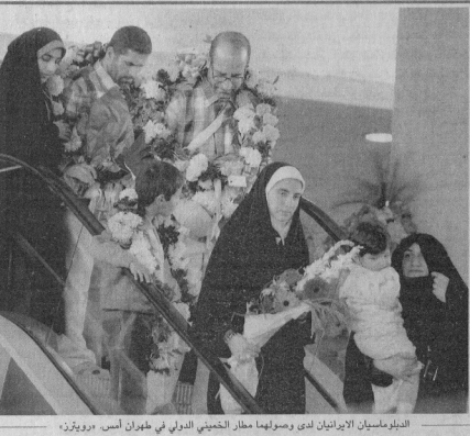
الديبلوماسيون الإيرانيون لدى وصولهم مطار الخميني الدولي في طهران أمس

استهداف دورية للشرطة غرب كركوك (شمال بغداد) كما أعلن الجيش الأمريكي مقلًا جنديين أمريكيين الإربعاء في عمليات قتالية. واعتاد مصدر أممي مساء أمس الأول انتقال ثلاثة «راهبين» عراقيين مسؤولين عن اغتيال عدد من منطلي المرجع الشيعي الأعلى آية الله من السيستاني خلال الأشهر الماضية في الحيف. وعلى صعيد التوتر الحدودي بين العراق وتركيا، وتكرت وكالاته أنها لم علاقة وثيقة بالانفصاليين الأكراد الأتراك أن حزب العمال الكردستاني، الذي تهدم تركيا بجناح شمال العراق لسفحه، الذي أسس إليه على استعداد لإقامة حوار قد يفضي إلى القائه السلاح. وقال بيان حزب العمال الكردستاني نقلته وكالة أنباء في أن لندن متفحون لإجراء حوار بشأن بدء عملية تستعد الأسلحة تماما اعتمادا على مشروع مباحث. لكنه قال أن قرارات وقف إطلاق النار من جانب واحد والتي أعلنتها المتطرفون في السابق قلقت في إنهاء الصراع. وتعتبر تركيا وأيضا الولايات المتحدة والاتحاد الأوروبي حزب العمال الكردستاني منظمة إرهابية. ورفضت أنقرة دوما في حوار مع المتطرفين.