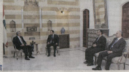
● سليمان خلال اجتماعه مع مشفي المعارضة في بيت الدين ببيروت أمس

وقال جبران باسيل وهو سياسي سنجي ساعمل مع المعارضة منذ أن تولى رئاسة مجلس الوزراء في 2005 وقال إن تشكيل حكومة جديدة من شأنه أن يفتح باب حوار جديد مع المعارضة.