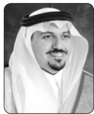
الأمير د. فيصل بن سعود بن عبد العزيز *

■ يشرفني ويسعدني بمناسبة مرور ست سنوات على مبايعة سيدي خادم الحرمين الشريفين الملك عبدالله بن عبدالعزيز - يحفظه الله - ملكاً على بلادنا (المملكة العربية السعودية) أن أرفع أسمى آيات الشكر والولاء والطاعة والتقدير لمقام سيدي خادم الحرمين الشريفين الملك عبدالله بن عبدالعزيز رفعا للتهنئة لمقامه الكريم سائلا الله أن