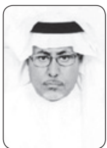
د.عبدالعزیز بن عثمان الفالح

ولقد استوقفتني يوم الأحد السادس والعشرين من شهر جمادى الآخرة لعام ١٤٢٢هـ، ذكرى بيعة الملك من أبنائه وإخوانه وأهله وعشيرته، فقلوب تخفق حبا وولاء صادقاً لرجل الحب والولاء والصدق في القول والعمل، وفتت عند تلك الذكرى العزیزة، وتساءلت في نفسي: ما سر هذا الحب والولاء؟ ما سر هذا التلاحم الفريد في زمن انفرط فيه كثير من العقود واختلت فيه بعض الموازين؟ وفتت عند تلك اليوم وتأملت ما سبقه من أيام سمان، أشرفت نورا وبهاء وعطاء وأماناً، تساءلت في نفسي: ما سر ذلك؟ أهو جاذبية الملك-حفظه الله- الخاصة التي يمتلكها أم العاطفة الجياشة حبا وعطفا على رعيته وما استرعاه الله، أم بدعته القريبة تجاه أبنائه وخشيته عليهم وما أصاب بعضهم، أم رغبته الأكيدة لحب الخير لشعبه ومن يقيم على أرض مملكته؟ أم أن سر ذلك يكمن في الأسلوب والنهج الفريد لحكم المملكة العربية السعودية؟ أم لإدارته للأزمات والحكمة؟ أم للإصلاحات والعطاءات اللامحدودة؟ حب الملك لشعبه وحب الشعب للملك. يقيني أنها هبة إلهية تحمد الله سبحانه وتعالى عليها، وينسأله أن يديها إنه القادر على ذلك. ومن حق هذا الملك الجليل- واعترافا بالجميل، ومن أجل الوصول إلى نتائج علمية- أن ندرس شخصية وعقريه وسياسة وحكمة الملك عبدالله بن عبدالعزيز دراسة علمية اجتماعية نفسية؛ ليستفاد منها ويدرسها طلبة السياسة والاقتصاد والاجتماع، والإدارة ويستفيد منها العالم أجمع، وعلى أبناء الملك عبد الله بن عبدالعزيز المتبعين للجامعات أن يخصصوا بحوثهم واطروحاتهم العلمية لدراسة شخصيته الفذة من جوانب عدة، على سبيل المثال لا الحصر: