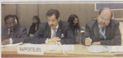
السفير عبدالله عبدالطيف مخرسا وفد الترويكا

تقدم به، ولدى السفير البحريني على ما توليه المملكة العربية السعودية من اهتمام بالتعليم وتوفير فرص التعليم للجميع سواء ورجالا على سواء وفي جميع مراحلها بالمجان، ايمانا منها بان التعليم هو اعم الابدان التي تضمن الفهم والمتعمق والعمل بحقوق الإنسان، الامر الذي انعكس في التطور الاجتماعي والاقتصادي والنقابي، كما وتقدم عبدالله عبد الطيف عبدالله السفير البحريني بالتوصيات التالية: 1. الاندماج بمبادرات المملكة العربية السعودية التي تهدف إلى تعزيز الحوار وإضاعة روح التسامح بين ثقافة الشعوب. 2. تشجيع المفكرة على تعزيز وتوسيع تجربتها الساجحة فيما يتعلق بإعادة تأهيل المتهمين والمستهجنين في قضايا الإرهاب، بحيث يتمثل التسامح بين الثقافات الإنسانية 3. فتح المملكة على سرعة إصدار مشروع نظام الجمعيات والمؤسسات الأهلية وبضمن أحكامها تسهيل عمل تلك الجمعيات والمؤسسات وسماحها على اداء مهامها بفعالية واستقلال.