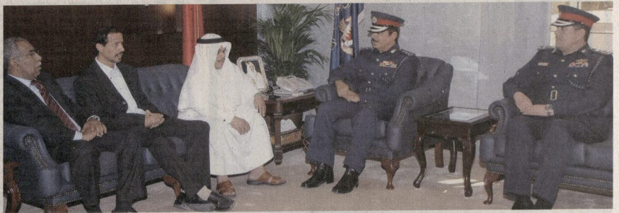
• وزير الداخلية مجتمعاً مع الأمين العام لاتحاد نقابات عمال البحرين

وتبذل الجهد لارتقاء بمستواه، مشيداً بالوعي والتضج البحرينيين الذين يتمتعون بها العامل البحريني والذين ساهموا في تحقيق التنمية الاقتصادية الشاملة التي تشهدها المملكة، ونوه إلى الدور الذي تقوم به الدولة بكافة مؤسساتها من أجل الاهتمام بالعمال ورفعتهم، مشيراً إلى أهمية التعاون في هذا المجال بين الدولة ومؤسسات المجتمع المدني المختلفة من أجل تحقيق الصالح العام وصالح العامل البحريني. وأشار وزير الداخلية إلى أهمية استمرار مثل هذه اللقاءات التي