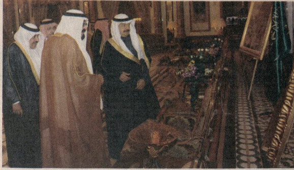
● جانب من لقاء خادم الحرمين ورئيس الوزراء