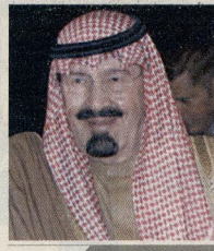
الملك عبدالله بن عبدالعزيز