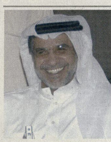
الشيخ حسام بن عيسى

التنمية الحضرية والإسكان وهي الجائزة التي يتولى سموه تمويلها وجعلها عملاً مؤسسياً مستمرا. وأشار إلى أن منكرة التفاهم الموقع مع برنامج الأمم المتحدة للمستوطنات البشرية تعدد مسؤوليته كل طرف ضماناً وتأكيداً لاستمرارية الجائزة التي ستستمر لأول مرة في المنتدى الحضري العالمي الرابع الذي سيعقد في مدينة ناخين الصينية في أوائل نوفمبر المقبل. ووسط تصفيق حار رحبت الوفود المشاركة في لجنة الممثلين الدائمين ببرنامج الأمم المتحدة للمستوطنات البشرية بعبارة البحرين ومعها لبرنامج الأمم المتحدة وصفة خاصة لإنشاء جائزة باسم صاحب السمو الشيخ خليفة بن سلمان آل خليفة رئيس الوزراء تسهم في دعم السياسات والاستراتيجيات الجديدة والمبتكرة بشأن التخطيط والإدارة والتنمية الاقتصادية والحد من الفقر.