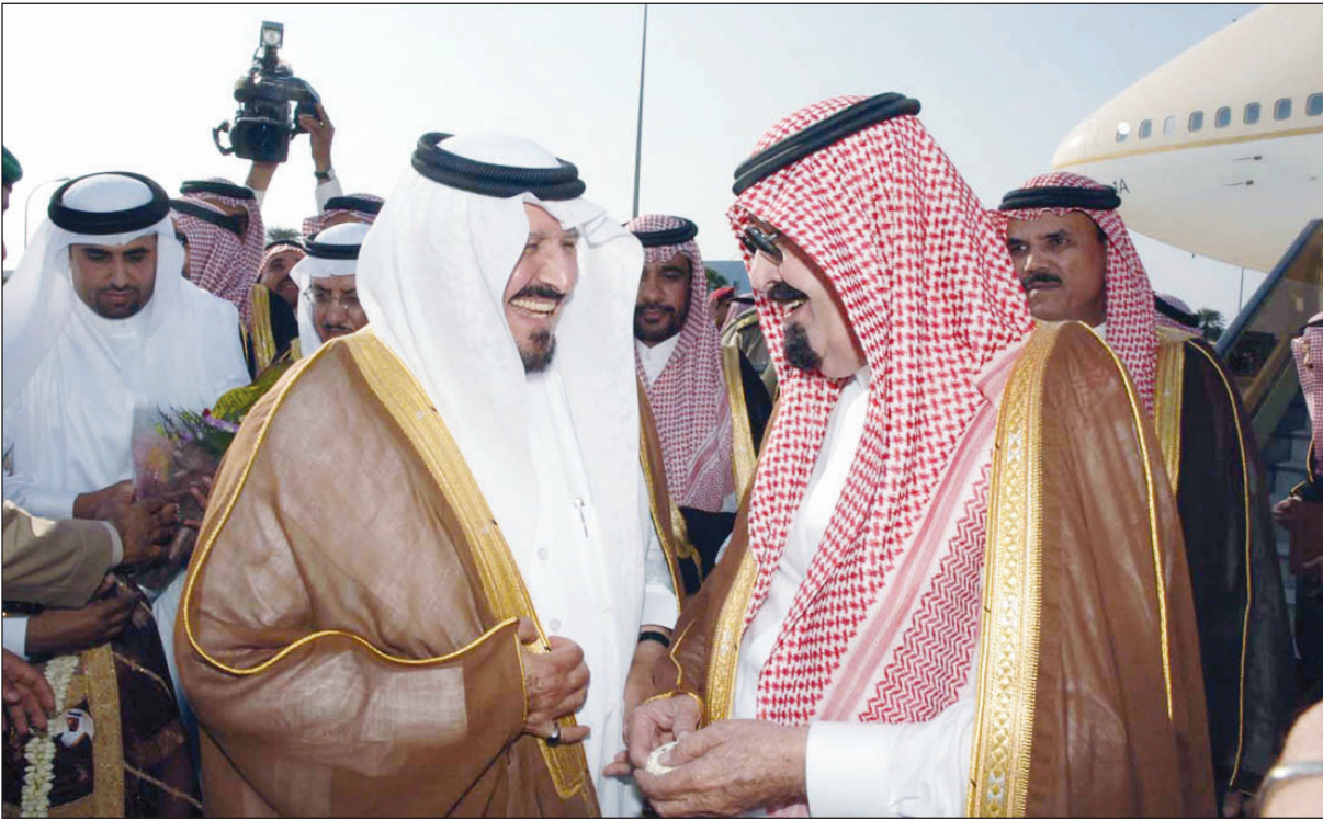
الملك وولي العهد في إحدى المناسبات السعيدة

رفع دولة رئيس مجلس الوزراء اللبناني نجيب ميقاتي أسمى التهاني لخدام الحرمين الشريفين الملك عبدالله بن عبدالعزيز آل سعود - حفظه الله - وحكومة وشعب المملكة العربية السعودية بمناسبة ذكرى اليوم الوطني الـ ٨١ للمملكة. وقال في تصريح له بهذه المناسبة "إن المملكة شهدت في عهد خادم الحرمين الشريفين نقلة حضارية شاملة في كل الميادين، ومرحلة من التطور والتنمية والتحديث وضعتها في مصاف الدول المتقدمة، وترك خادم الحرمين الشريفين بصمته على هذه الإنجازات التي يصعب حصرها وتكرها، وبخاصة اهتمامه بخدمة الإسلام والمسلمين وعمارة الحرمين الشريفين والمدينتين المقدستين مكة المكرمة والمدينة المنورة والشاعر المقدسة". وأشاد الرئيس ميقاتي بالدور الرائد الذي تضطلع به الملكة بقيادة خادم الحرمين الشريفين وسمو ولي عهده الأمين في دعم القضايا الإسلامية والعربية ونصرتها، وقال: "المملكة تؤدي دور صمام الأمان على الساحات الإسلامية والعربية والعالمية بالنظر إلى التقدير الذي تحظى به". وقدم دولة رئيس الحكومة اللبنانية الشكر للمملكة العربية السعودية على المبادرات الكريمة التي قدمتها للبنان وشعبه ووقوفها إلى جانبه للخروج من محنة سليما وأكثر منعة. كما عبر عن أواصر المحبة التي تربط البلدين وشعبهما الشقيقين، والتي تعززت في عهد خادم الحرمين الشريفين الملك عبدالله بن عبدالعزيز آل سعود متمنيا له دوام الصحة والتوفيق، وأن يمدد المولى عز وجل بعونه ما له فيه تقدم شعب المملكة وخير الأمتين الإسلامية والعربية.