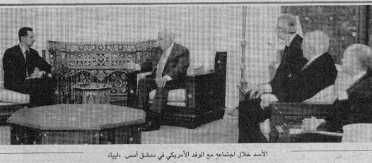
الأسد خلال اجتماعه مع الوفد الأمريكي في دمشق أمس، أينا.

المتحدة بعد الرئيس الأمريكي وتلقاه ديك تشيني. وقالت وكالة الأنباء السورية (سانا) أمس ان الرئيس شار الأسد التقى بوفد من بيولوجي في دمشق لبحث الأوضاع في العراق. وصادق بيان مشترك لنبواب الثلاثة وقدمت السفارة الأمريكية في دمشق