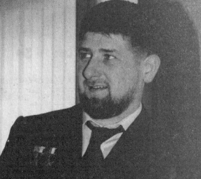
قديروف (وسط) مع الرئيس الشيشاني لحضور جلسة تعيينه رئيساً للبلاد. «روزبروت».

وقال قديروف لوجر قوي بيته معارضة بوتكين انتكاشات لحقوق الإنسان رئيساً جديداً للامتلحظ.