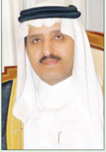
الأمير أحمد بن عبدالعزيز

رفع صاحب السمو الملكي الأمير أحمد بن عبدالعزيز وزير الداخلية رئيس لجنة الحج العليا برقية لخادم الحرمين الشريفين الملك عبدالله بن عبدالعزيز آل سعود - حفظه الله - أعلن خلالها اكتمال وصول الحجاج القادمين من الخارج لحج هذا العام ١٤٣٣هـ الذين بلغ عددهم (١,٧٥٢,٩٣٢) مليوناً وسبعائة واثنين وخمسين ألفاً وتسعمائة واثنين وثلاثين حاجاً، وعدد الذكور منهم (٩٥١,٨٠٦) مليونون نسبة (٥٤٪) ، وعدد الإناث (٨٠١,١٢٦) يمثلن نسبة (٤٦٪). وقال سمو وزير الداخلية رئيس لجنة الحج العليا " يشرفني في