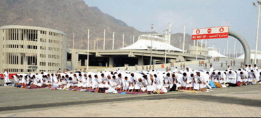
إحدى المصليات المنتقلة

والعدل، وشارع صدقي العريزية، وشارع الحج قرب الجمرات، بالإضافة للساحة القريبة من الجمرات باتجاه الحرم، ومحطة سكة القطار بمنى، ومحبس الجن. وأكد حرص سمو رئيس هيئة البيعة على إقامة المشروع في مكة المكرمة والمشاعر المقدسة، متوقفاً أن يخدم أكثر من مليون حاج خلال حج هذا العام. وبين الحسينان أن المصليات زودت بشاشات ضوئية تعرض للحجاج أعمال الحج والصلاة بعدة لغات، ليستفيدوا منها ويتفقهوا بأمر دينهم ومناسك حجهم.