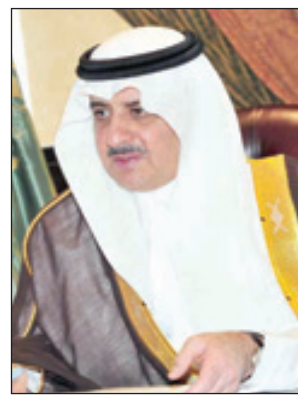
الأمير فهد بن سلطان

يستقبل صاحب السمو الملكي الأمير فهد بن سلطان بن عبدالعزيز أمير منطقة تبوك جموع المهينين بعيد الأضحى المبارك بعد أداء صلاة العيد بصلى العيد، وذلك في منزل سموه. ويتبادل أمير تبوك مع أهالي المنطقة التهانئ بالعيد المبارك، كما يستقبل سموه مشايخ القبائل وعدد الأعيان وأعضاء مجلس المنطقة وأعضاء المجالس المحلية والبلدية ومديري الإدارات الحكومية وقادة وضباط أفرع القوات المسلحة والأمن الداخلي بالمنطقة حيث سيتناول الجميع طعام الإفطار على مأدبة سموه الكريم. وسيؤدي المصلون صلاة عيد الأضحى في ١٨٣ جامعاً ومصلى في مدينة تبوك وفي مدن محافظات ومراكز المنطقة.