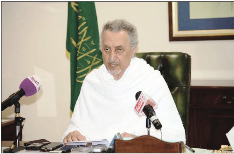
الأمير خالد الفيصل متحدثاً خلال المؤتمر الصحفي

ورداً على سؤال حول انعكاس المشاريع التي وفرتها الدولة لصالح خدمة الحجاج، أجاب سمو أمير منطقة مكة المكرمة، قائلاً: (توجد مشاريع هذا العام والأعوام السابقة، وسوف تنعكس هذا العام بشكل ممتاز، ورأينا في كل عام أن الاستعدادات ترتفع ويرتفع معها مستوى الأداء في هذه الخدمات، ويرتفع مستوى الرضا من الحجاج عن هذه الخدمات، وهو أمر