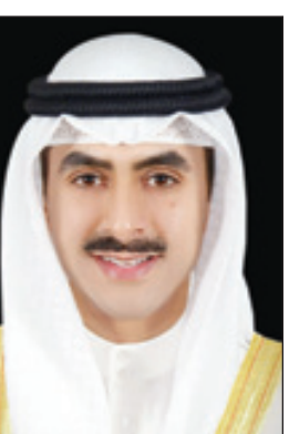
الشيخ ثامر الصباح

التأسيس مكاسب كبيرة على طريق التقدم والأمن والاستقرار والتنمية الاقتصادية ومواكبة التطورات المستجدة في أنحاء العالم كافة. وأوضح أن من أهم ما عزز ركائز هذه الدولة هو الثقة الملموسة بين القيادة والشعب، ومبدأ التواصل المنبثق من سياسة الباب المفتوح، منوها في هذا السياق بما تشهده المملكة في هذا العهد الميمون بقيادة وتوجيهات خادم الحرمين الشريفين من العديد من الإصلاحات والإنجازات الواعدة التي تسير بوتيرة متسارعة وخطى راسخة،