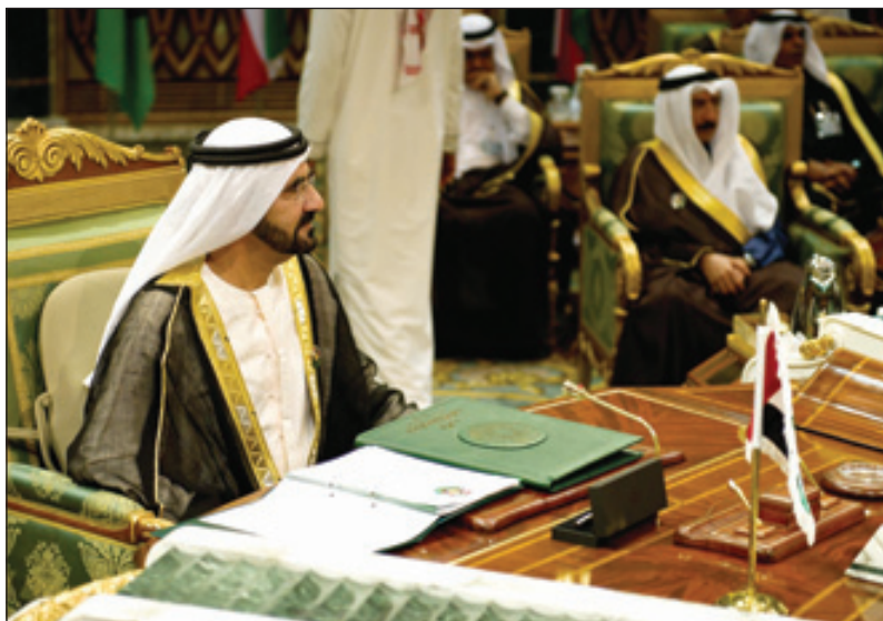
الشيخ محمد بن راشد نائب رئيس دولة الإمارات خلال الجلسة الافتتاحية