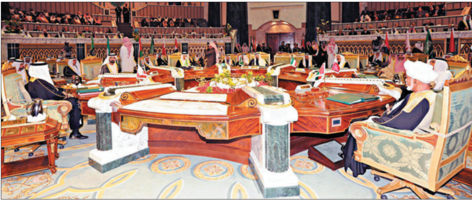
لقطة بانورامية من الجلسة الافتتاحية للقمّة الخليجية برئاسة خادم الحرمين دواس،

نجتمع في ظل تحديات تستدعي منا اليقظة وزمنا يفرض علينا وحدة الصف والكلمة