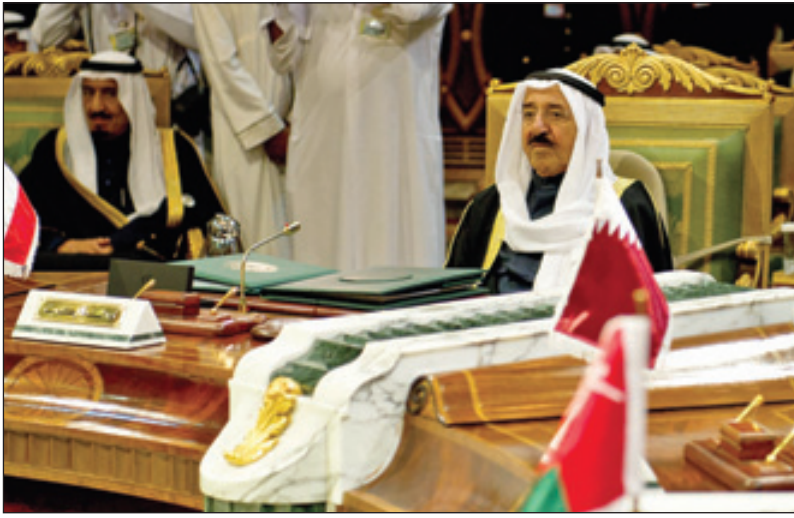
الشيخ صباح الأحمد الصباح أمير دولة الكويت يستمع إلى كلمة خادم الحرمين