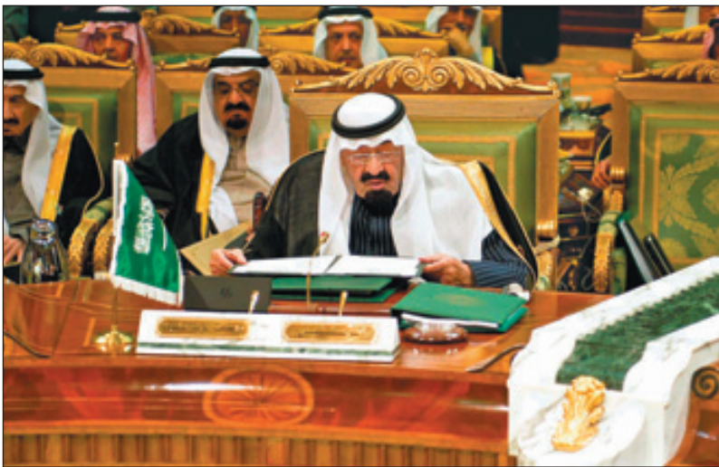
الملك يلقي كلمته التاريخية

إثر ذلك أعلن معالي الأمين العام لمجلس التعاون لدول الخليج العربية الدكتور عبداللطيف بن راشد الزياتي انتهاء الجلسة الافتتاحية . ويضم وفد المملكة العربية السعودية الرسمي لاجتماعات الدورة الثانية والثلاثين للمجلس الأعلى لمجلس التعاون لدول الخليج العربية كلاً من : صاحب السمو الملكي الأمير مشعل بن عبدالعزيز رئيس هيئة البيعة وصاحب السمو الملكي الأمير متعب بن عبدالعزيز وصاحب السمو الملكي الأمير نايف بن عبدالعزيز آل سعود ولي العهد نائب رئيس مجلس الوزراء وزير الداخلية وصاحب السمو الملكي الأمير سلمان بن عبدالعزيز وزير الدفاع وصاحب السمو الملكي الأمير سعود الفيصل وزير الخارجية وصاحب السمو الملكي الأمير عبدالله بن عبدالعزيز مستشار خادم الحرمين الشريفين وصاحب السمو الملكي الأمير مقرن بن عبدالعزيز رئيس الاستخبارات العامة وصاحب السمو الملكي الأمير