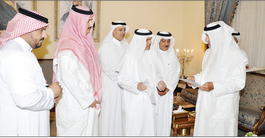
الأمير خالد الفيصل مستقبلاً المهندس الشيخ

وأكد رئيس القطاع الغربي أن الشركة وفرت بحمد الله كل الإمكانيات الفنية والبشرية مما ساهم في نجاح الخطة التشغيلية للنظام الكهربائي التي أعدتها الشركة حيث إنها تسعى دوماً لأن تكون خدمة الكهرباء بكل من مكة المكرمة والمشاعر المقدسة والمدينة المنورة على مستوى عال من الموثوقية والكفاءة في الأداء في سبيل راحة الحجاج وكل من له علاقة بخدومتهم من مواطنين ومقيمين وإدارات حكومية ومؤسسات تجارية.