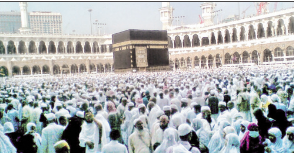
المسجد الحرام يشهد كثافة كبيرة من الحجاج