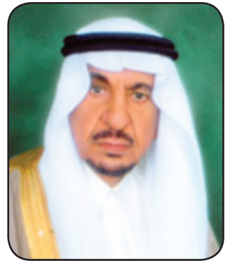
الشيخ محمد بن عبدالعزيز الجعيج *

لقد كان لاختيار صاحب السمو الملكي الأمير سلمان بن عبدالعزيز الدفاع وزير الكبير في نفوس المواطنين وتلك ثقة ملكية عالية يستحقها الأمير سلمان وعن جدارة واستحقاق وهو شخصية قيادية