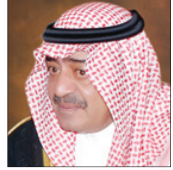
الأمير مقرن بن عبدالعزيز

صدر أمر ملكي أمس بإعفاء صاحب السمو الملكي الأمير مقرن بن عبدالعزيز رئيس الاستخبارات العامة من منصبه وتعيينه مستشاراً ومبعوثاً خاصاً لخادم الحرمين الشريفين بمرتبة وزير، وتعيين صاحب السمو الملكي الأمير بندر بن سلطان بن عبدالعزيز رئيساً