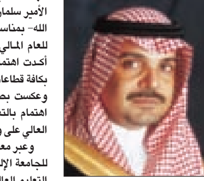
الأمير عبدالعزيز بن ماجد

للمدينة المنورة - سالم الأحمدى نوه صاحب السمو الملكي الأمير عبدالعزيز بن ماجد بن عبدالعزيز أمير منطقة المدينة المنورة بحرص خادم الحرمين الشريفين الملك عبدالله بن عبدالعزيز آل سعود وسمو ولي عهده الأمين -حفظهما الله- على رفع مستوى الإنفاق على المشاريع التنموية التي تخدم المواطن مباشرة، وتستهدف توفير العيش الكريم لأبناء الوطن في مناطق المملكة كافة. وعد سموه الأرقام القياسية