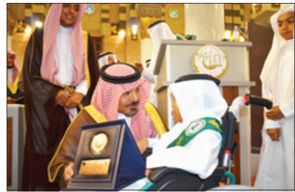
لفتة من سموه لأحد الطلاب من ذوي الاحتياجات الخاصة - عسة - فاين للطيري

الحرمين الشريفين الملك عبدالله بن عبدالعزيز من جهوده لخدمة هذا القرآن العظيم.