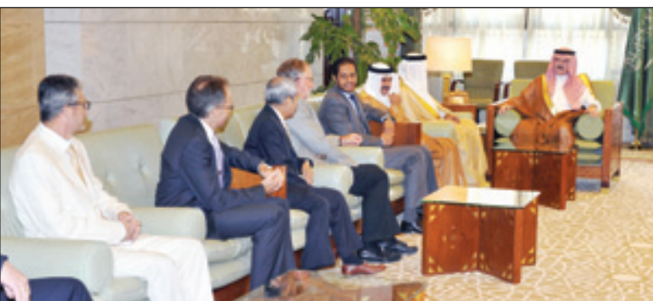
أمير الرياض يستقبل المهنيين

الرياض، واس استقبل صاحب السمو الملكي الأمير سطاتم بن عبدالعزيز أمير منطقة الرياض في مكتب سموه بقصر الحكم أسس الأمين العام لمجلس التعاون لدول الخليج العربية الدكتور عبداللطيف بن راشد الزياتي، وعميد السلك الدبلوماسي المعتمد لدى المملكة سفير دولة قطر علي بن عبدالله آل محمود، يرافقه عمداء المجموعات العربية والأفريقية والآسيوية وأمريكا الشمالية والأوروبية والأطلسية وأمريكا الجنوبية الذين قدموا لسموه التهانى بمناسبة حلول شهر رمضان المبارك.