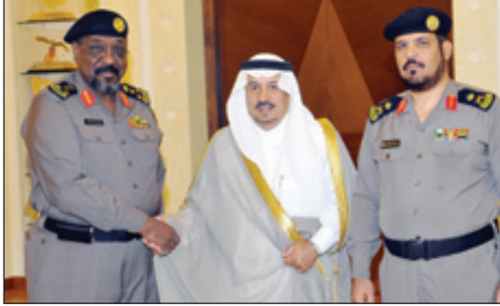
الأمير فيصل يقبل مدير دوريات الأمن رتبته الجديدة

خلال رعايته حفل تخريج ١٤٨ من حفاظ كتاب الله