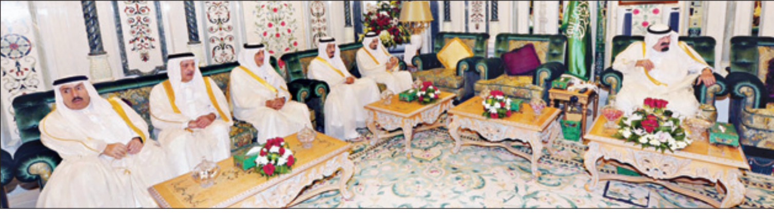
خادم الحرمين خلال حفل العشاء

مكة المكرمة - و.أ.س ■ وصل بحفظ الله ورعايته خادم الحرمين الشريفين الملك عبدالله بن عبدالعزيز آل سعود مساء أمس إلى مكة المكرمة قادماً من جدة لقضاء ما تبقى من شهر رمضان المبارك بجوار بيت الله الحرام. وكان في استقبال الملك المفدى لدى وصوله إلى قصر الصفا صاحب السمو الملكي الأمير سلمان بن عبدالعزيز آل سعود ولي العهد نائب رئيس مجلس الوزراء وزير الدفاع، كما كان في استقباله أيده الله صاحب السمو الأمير فيصل بن تركي بن عبدالله وصاحب السمو الملكي الأمير خالد الفيصل بن عبدالعزيز أمير منطقة مكة المكرمة وصاحب السمو الملكي الأمير ممدوح بن عبدالعزيز وصاحب السمو الملكي الأمير بندر بن سلطان بن عبدالعزيز رئيس الاستخبارات العامة والأمين العام لمجلس الأمن الوطني وصاحب السمو الملكي الأمير سعود بن نايف بن عبدالعزيز رئيس ديوان سمو ولي العهد المستشار الخاص لسموه وصاحب السمو الملكي الأمير بندر بن خالد الفيصل وصاحب السمو الملكي الأمير خالد بن بندر بن سلطان بن عبدالعزيز وصاحب السمو الملكي الأمير محمد بن سلمان بن عبدالعزيز المستشار الخاص لصاحب السمو الملكي الأمير آل سعود وصاحب السمو الملكي الأمير بن ناصر بن عبدالعزيز مستشار خادم الحرمين الشريفين ومستشار خادم الحرمين الشريفين الأمير الوليد بن طلال بن عبدالعزيز وصاحب السمو الملكي الأمير منصور بن ناصر بن عبدالعزيز مستشار خادم الحرمين الشريفين وصاحب السمو الأمير الدكتور بندر بن سلمان بن محمد مستشار خادم الحرمين الشريفين وصاحب السمو الأمير الدكتور خالد بن عبدالعزيز التويجري ومعالى الرئيس العام لشؤون المسجد الحرام والمسجد النبوي الشيخ الدكتور عبدالرحمن بن عبدالعزيز السديس ومعالى رئيس الشؤون الخاصة لخادم الحرمين الشريفين