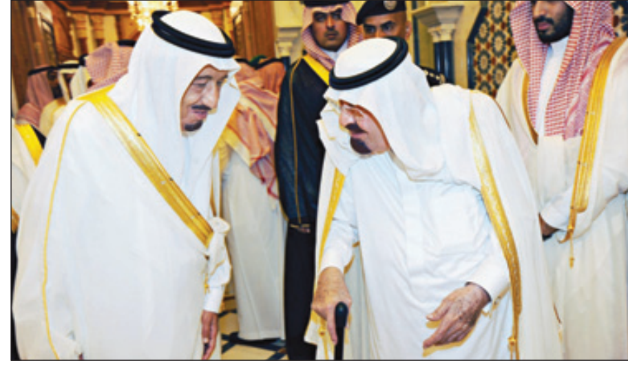
وصول خادم الحرمين إلى مكة المكرمة وسمو ولي العهد في مقدمة مستقبليه (و.أ.س)