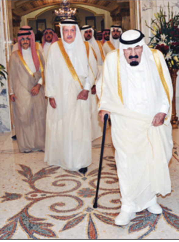
مغادرة خادم الحرمين جدة (و.أ.س)