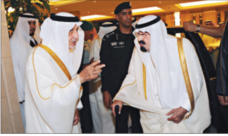
الملك عبد الله لدى وصوله إلى مكة المكرمة