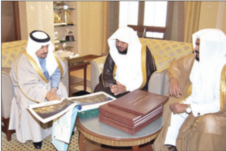
الأمير فيصل بن بندر يستعرض مخططات مشاريع مدينة الخير