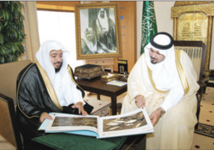
الأمير فيصل بن مشعل يطلع على مخططات مدينة الخير