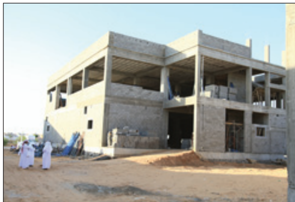
جانب من الأعمال الإنشائية للمستودعات الرئيسية