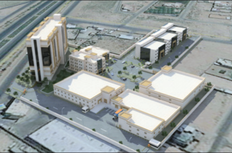
منظر تخطيطي لوحدة ومرافق مدينة الخير ببريدة