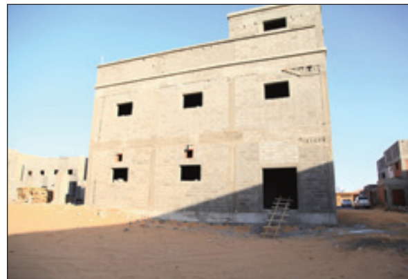
أعمال إنشائية لبعض الوحدات المساندة والورش