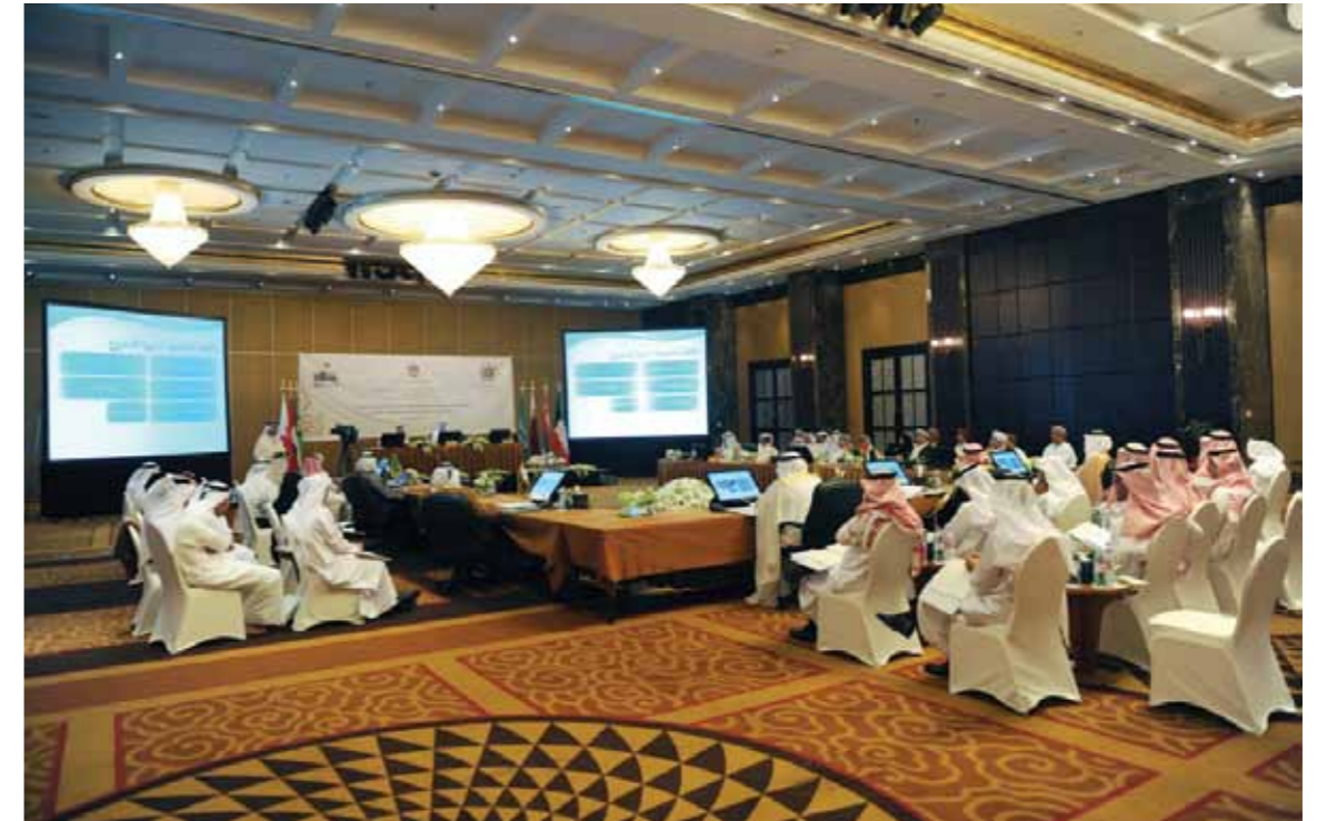
أبو ظبي: التقاعد

التسيق بين أجهزة التقاعد المدني وهيئاته في دول مجلس التعاون لدول الخليج العربية