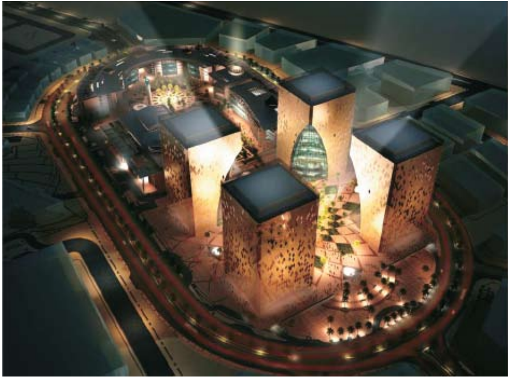
مجمع تقنية المعلومات

الهدف رفع معدل تدفق رؤوس الأموال وزيادة قوة المنافسة العالمية لشركات تقنية المعلومات بالمملكة.