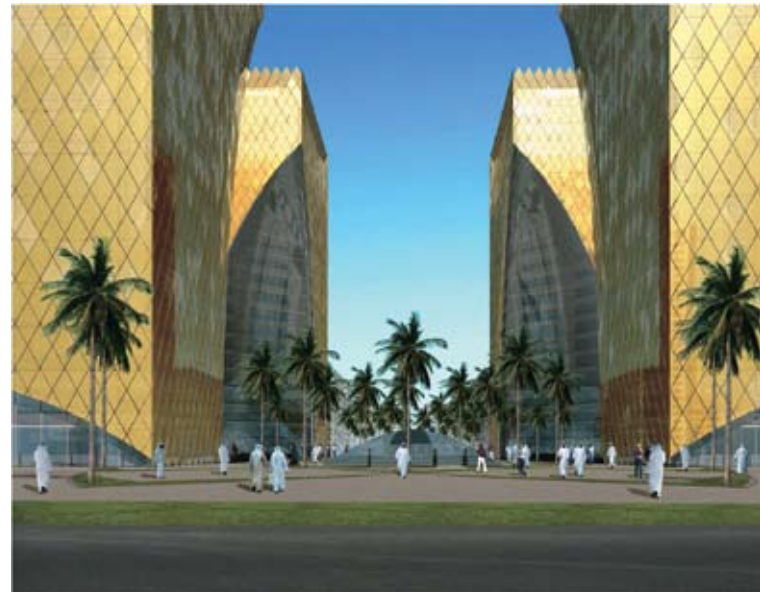
شكل آخر يوضح المجمع من زاوية مختلفة

وتم تصميم المنطقة الوسيطة بمساحة إجمالية «٢٠٩٤,٠٩٢م ٢ » في قلب مجمع تقنية المعلومات والاتصالات، بحيث تكون مؤهلة لاستضافة مختلف النشاطات الترفيهية بما تحتويه من: مناطق خضراء، ومناطق مفتوحة، وجلسات، وبحيرة مائية.