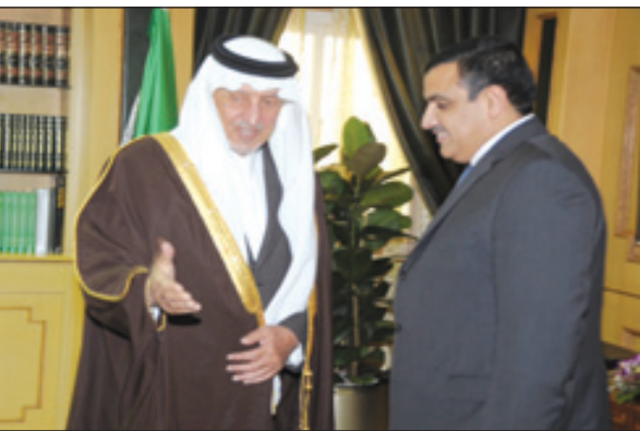
.. ويلتقي السفير التونسي