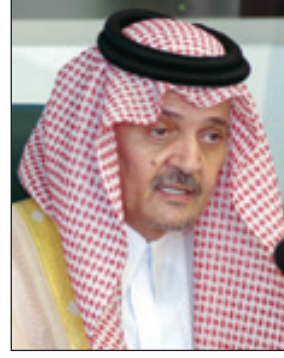
الأمير سعود الفيصل

نقل الرسالة لسمو أمير دولة الكويت، صاحب السمو الملكي الأمير سعود الفيصل وزير الخارجية خلال استقبال سمو الشيخ صباح الأحمد الجابر الصباح في قصر بيان والوفد المرافق له، وفقاً لما أوردته وكالة الأنباء الكويتية. حضر اللقاء معالي النائب