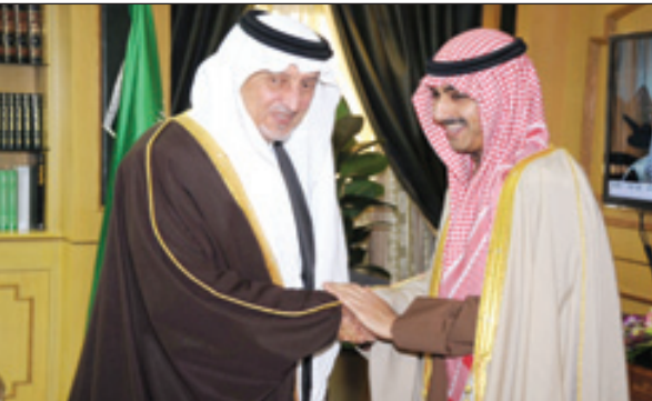
الأمير خالد الفيصل مستقبلاً الشيخ ثامر الصباح