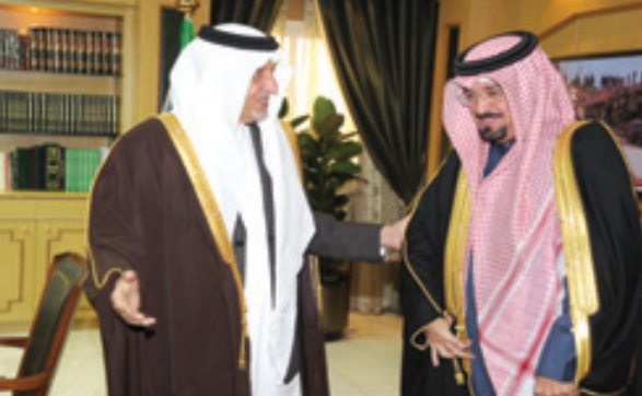
سموه يرحب بالشيخ حمود آل خليفة