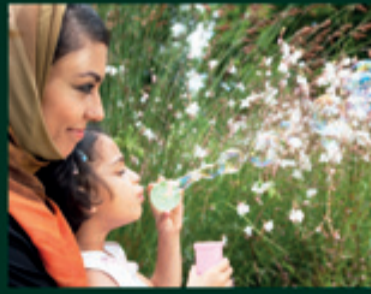
حيث المستقبل المشرق لاسرتك

فندق الفيصلية - قاعة الأمير سلطان السبت والأحد في 12-13 جمادى الآخرة 1435 هـ / 12-13 أبريل 2014 م من الساعة 10:00 صباحاً حتى 10:00 مساءً