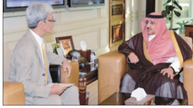
الأمير محمد بن نايف يستقبل السفير الياباني

الرياض - واس استقبل صاحب السمو الملكي الأمير محمد بن نايف بن عبدالعزيز وزير الداخلية، في مكتب سموه بوزارة الداخلية، في الرياض أمس، سفير جمهورية تركيا لدى المملكة يونس دميرار. كما استقبل سمو وزير الداخلية في مكتبه