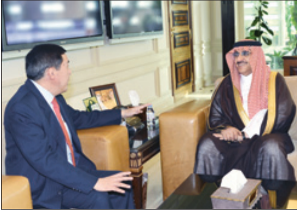
الأمير محمد بن نايف لدى استقباله السفير السنغافوري