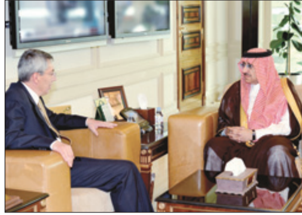
وزير الداخلية خلال استقباله السفير التركي