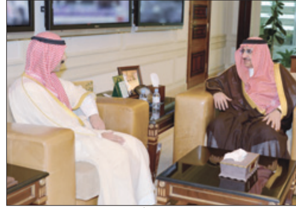
وزير الداخلية يستقبل السفير الكويتي