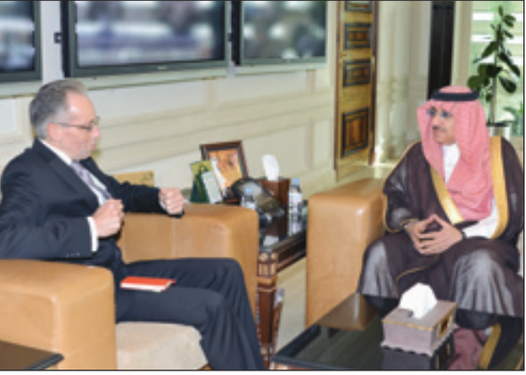
وزير الداخلية يستقبل السفير الأسترالي