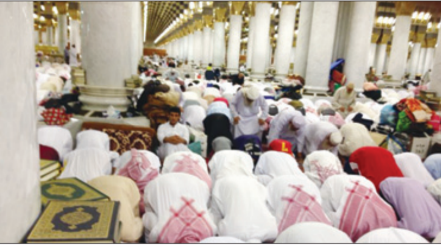
صلاة التهجد ليلة أسس