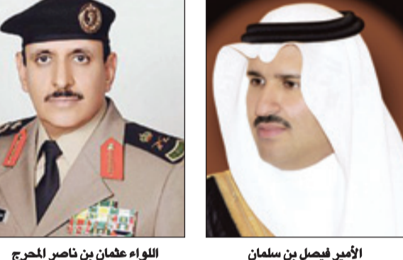
الواء عثمان بن ناصر المحرج الأمير فيصل بن سلمان

زيادة أعداد الزائرين للمدينة المنورة - سالم الأحمدى يتابع صاحب السمو الملكي الأمير فيصل بن سلمان بن عبدالعزيز أمير منطقة المدينة المنورة من مكتبه جوار الحرم عن كثب تنفيذ خطط الأجهزة الحكومية والأهلية لخدمة الزوار وذلك بعد مرور نصف العشر الأواخر من رمضان وزيادة أعداد الزائرين للمدينة