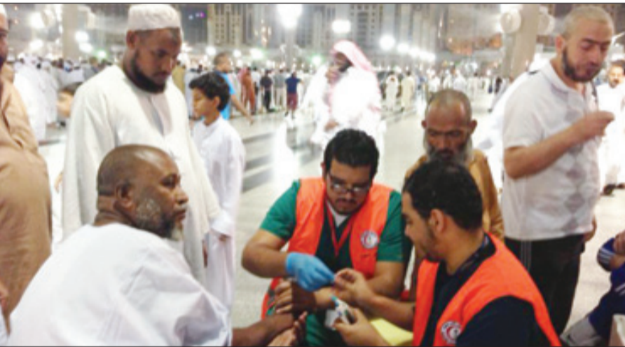
إسعاف عاجل لأحد الزائرين حول الحرم

الأمن العام اللواء عثمان بن ناصر المحرج أكبر الأثر في دفع عجلة العمل والتغلب على صعوباته، ونسعد يومياً بتلقى توجيهاته وقد تحقق ولله الحمد خدمة الزوار على أكمل وجه، رغم الحشود الكبيرة التي شهدتها المسجد النبوي ابتداءً من ليلة ٢١ بداية صلاة التهجد والاعتكاف داخل أروقة الحرم. وأشاد أنه لم تسجل ولله الحمد أي قضية ضد مجهول من بداية رمضان حتى اليوم بفضل الله وتوفيقه.