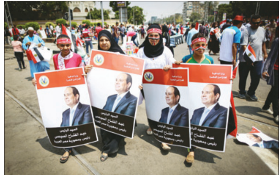
مصريون يحتفلون أمام قصر الاتحادية حاملين صور الرئيس السيسي.

عبدالعزيز آل سعود وفخامة الرئيس عبدالفتاح السيسي بمناسبة انتخابه رئيساً لجمهورية مصر العربية، كما قدم تهانيه لفخامته وتمنياته له بالتوفيق، مؤكداً سموه مواقف المملكة القابضة لدعم جمهورية مصر العربية والحفاظ على أمنها واستقرارها. وعبر فخامة الرئيس المصري من جهته عن شكره وتقديره لخادم الحرمين الشريفين الملك عبدالله بن عبدالعزيز آل سعود