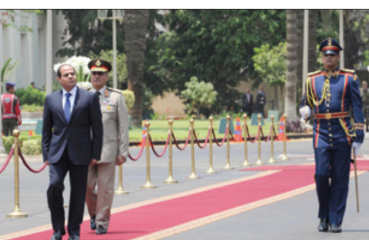
الرئيس السيسي يستعرض حرس الشرف في قصر الاتحادية

وقال منصور "أما رئيس مصر الجديد فأقول اختارك المصريون في انتخابات حرة ونزيهة وفاء وعرفانا بوطينتك وبدورك في الحفاظ على هذا الوطن وحدته وهويته واختاروك أيضاً ثقة منهم في قدرتك على ان توفر لهم الامن والامان وان تحقق لهم تطلعاتهم في حياة أفضل لهم ولابنائهم. وأضاف "السيد الرئيس اننى على ثقة في انكم ومن خلال هذا الدعم الشعبي الكبير ستنجحون في تحقيق آمال وتطلعات المصريين وأرجو من الله أن يلهمكم الصواب وحسن اتخاذ القرار وأن يعينك على مواجهه كافة التحديات ويجعلك لهذا الوطن مغتماً".