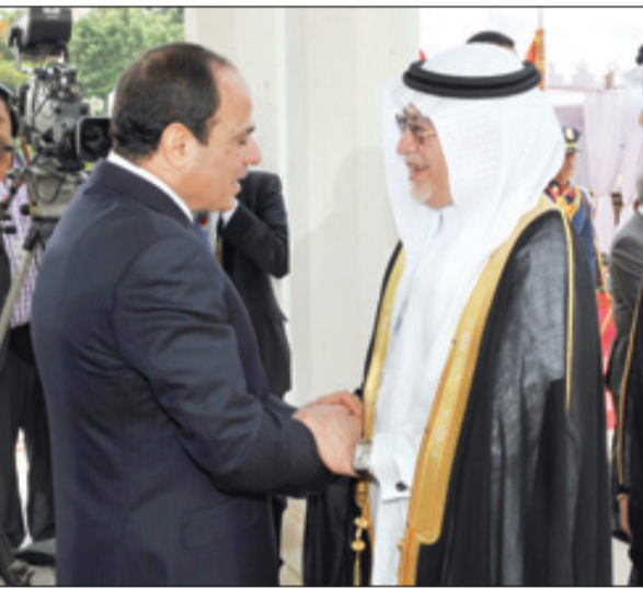
.. والدكتور عبدالعزيز خوجه