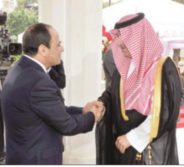
السيسي يتلقى تهنئة الأمير عبدالعزيز بن عبدالله