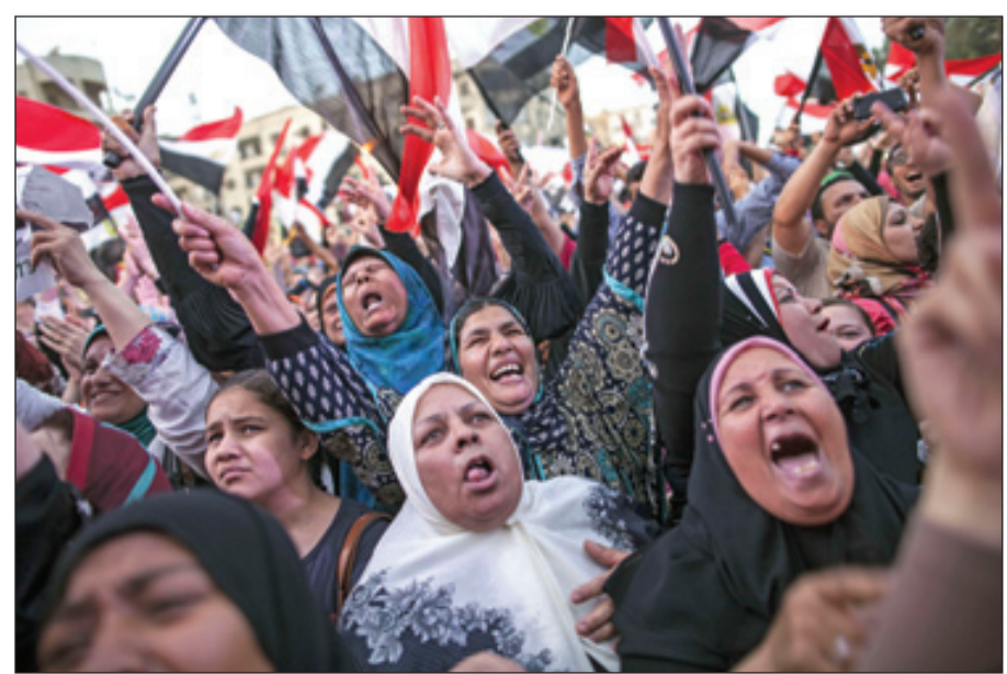
سيدات مصريات يزينعن تعبيراً عن فرحتهن أمام قصر الاتحادية