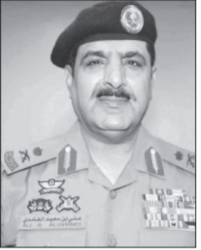
اللواء علي بن سعيد الغامدي

تقديم كثير من الخدمات الإنسانية سواء مساعدة كبار السن أو إرشاد التائهين أو إسعاف بعض الحالات المرضية. وأهاب قائد قوة الطوارئ الخاصة بسكان مكة المكرمة من مواطنين ومقيمين بأداء صلوات التراويح في المساجد المنتشرة في مكة المكرمة وإتاحة الفرصة لإخوانهم ضيوف الرحمن القادمين من خارج المملكة لأداء مناسك العمرة في الحرم المكي الشريف بكل يسر وسهولة. من جانبه قال مساعد مدير الأمن العام لشؤون التدريب اللواء علي بن سعيد الغامدي بأن هناك توسيعاً في محطة النقل الجماعي (باب الملك) عما كانت عليه في العام الماضي وكذلك تم توسيع مسار العربات المؤدية إلى الحلقة العلوية في المطاف المؤقت لما يتسع لعربتين خلفاً من العام الماضي، تقوم قوات الطوارئ الخاصة بتوفير أمن وسلامة ضيوف الرحمن وكذلك