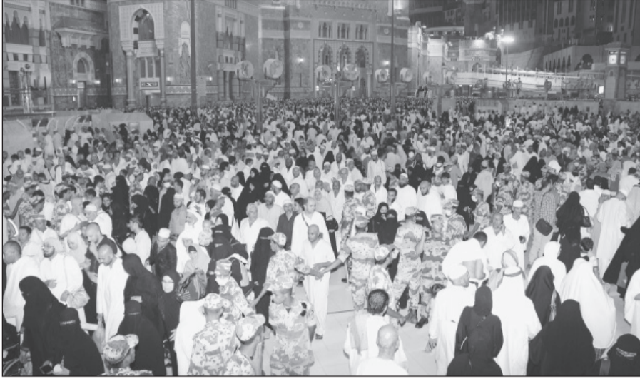
جهود رجال الامن في تنظيم دخول المصلين والمعتمرين للحرم

تنظيم الحشود لهذا العام حيث تحتاج حركة الحشود لتنظيم يتجدد بكل عام بناء على المعطيات الميدانية وأبرزها هذا العام الاستفادة من تشغيل توسعة خادم الحرمين الشريفين وساحاته وأيضاً إيجاد مساور تشغيل وتحويل على امتداد شارع إبراهيم الخليل على تقاطع جبل الكعبة مع شارع أم القرى وأيضاً سيتم فرش مياسط بالطرقات للمصلين عند احتمال المساحات بالمصلين وكذلك داخل الحرم والسطوح.