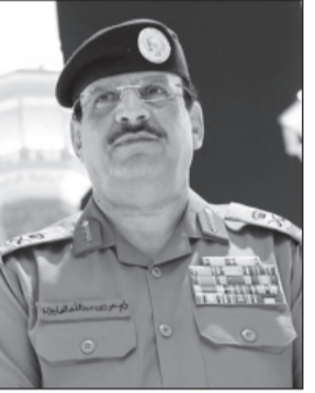
اللواء د. سعد بن عبدالله الخليوي