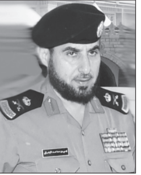
اللواء يحيى بن سعيد الزهراني