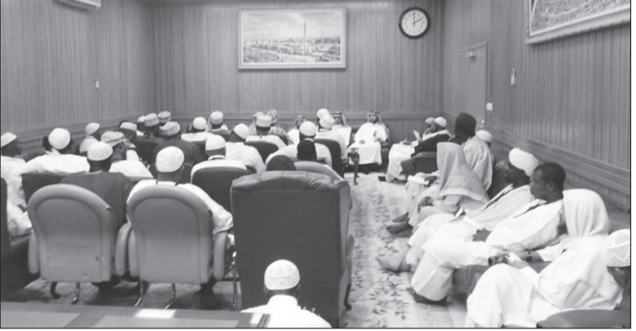
الفالح ملتقياً بالفوف

المدينة المنورة - سالم الأحمدي ■ استقبل نائب الرئيس العام لشؤون المسجد الحرام والمسجد النبوي الشيخ عبدالعزيز الفالح بمكتبه أمس مجموعة من لجنة الدعوة في أفريقيا، حيث رحب بهم وقدم لهم نبذة عن ما تقدمه المملكة من خدمات وتسهيلات لضيوف الرحمن وهو الأمر الذي تعده المملكة القدسة. وتطرق الفالح إلى الطريقة المثلى في الدعوة إلى الله التي كان السلف الصالح ينجحها في ما يخص الدعوة إلى الله بالحكمة والموعظة الحسنة وتاريخ الدعوة ونشاطهم في الدعوة إلى الله، وفي آخر اللقاء استمع الوفد إلى شرح مفصل وشامل عن التوسعات التي أمر بها خادم الحرمين الشريفين الملك عبدالله بن عبدالعزيز - حفظه الله - للمسجد النبوي الشريف والخدمات التي تقدمها وكالة الرئاسة العامة لشؤون المسجد النبوي لزيواره وتسمى الشيخ الفالح للوفد التوفيق في مهمتهم للدعوة إلى الله في أفريقيا، كما شكر المسؤول عن فريق الدعوة سمو الأمير بندر بن سلمان وسأل الله أن يوفقه في جهوده المبذولة بالدعوة إلى الله على يديه.