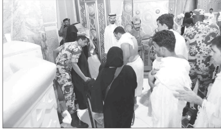
تنظيم رابع لرجال الامن بالمسجد الحرام

مكة المكرمة - تركي السويهي ■ يشهد شهر رمضان هذا العام تنظيماً مميزاً من قبل الجهات الامنية المعنية بخدمة قاصدي بيت الله الحرام من مصلين ومعتمرين.. حيث يقوم رجال الامن بتنظيم حركة المصلين والمعتمرين من وإلى المسجد الحرام. وأكد عدد من القيادات الامنية لـ "الرياض" ان هذا العام كان التنسيق كبيراً بين كافة القطاعات التي تهتم بخدمة قاصدي المسجد الحرام حيث استفادت الخطط المعدة في هذا العام من دروس الاعوام الماضية وعملت على تطويرها لتواكب المتغيرات الحاصلة في المسجد الحرام من حيث التوسعة الاستفادة من جزء في توسعة خادم الحرمين الشريفين للمسجد الحرام والتي رفعت الطاقة الاستيعابية.