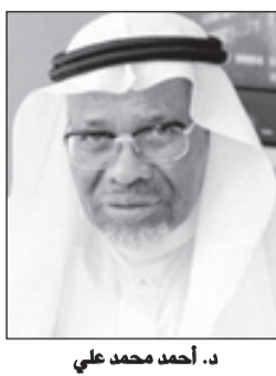
د. أحمد محمد علي

جدة - واس ■ رفع رئيس مجموعة البنك الإسلامي للتنمية الدكتور أحمد محمد علي، خالص التعازي وصادق المواساة لخادم الحرمين الشريفين الملك سلمان بن عبدالعزيز آل سعود، وصاحب السمو الملكي الأمير مقرن بن عبدالعزيز آل سعود ولي العهد نائب رئيس مجلس الوزراء، وصاحب السمو الملكي الأمير محمد بن نايف بن عبدالعزيز ولي ولي العهد النائب الثاني لرئيس مجلس الوزراء وزير الداخلية - وإلى الأسرة المالكة والشعب السعودي في وفاة الملك عبدالله بن عبدالعزيز - رحمه الله.