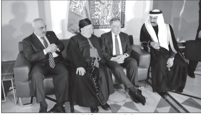
السفير عسيري يستقبل المعززين

بيروت - و.ا.س ■ واصلت سفارة خادم الحرمين الشريفين في لبنان أسس استقبال المعززين بوفاة خادم الحرمين الشريفين الملك عبدالله بن عبدالعزيز آل سعود - رحمه الله - حيث كان في استقبالهم السفير علي بن سعيد عوض عسيري ومسديرو المكاتب السعودية وأعضاء الدبلوماسية، وذلك في قاعة الرئيس رفيق الحريري للاجتماعات بجامع محمد الأمين بوسط بيروت. وكان من بين المعززين الذين توافدوا لتقديم العزاء رئيس مجلس الوزراء اللبناني تمام سلام ورئيس الجمهورية اللبنانية السابق ميشال سليمان ورئيس مجلس الوزراء اللبناني الأسبق رئيس كتلة المستقبل النيابية فؤاد السنهوري.