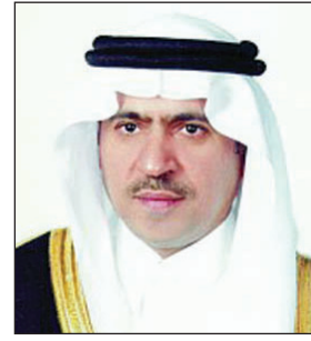
د. أحمد السالم

ولي ولي العهد والنائب الثاني لرئيس مجلس الوزراء وزير الداخلية الدكتور أحمد بن محمد السالم، أن أفة المخدرات لا تقل خطورة عن ظاهرة الإرهاب، وأن استهداف شبابنا ومجتمعنا بالمخدرات يأتي ضمن مخطط لتعطيل قدراتهم وتمزيق نسيجهم المتماسك والمبني على قيمنا وعاداتنا الإسلامية.