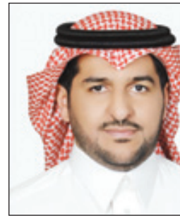
د. خالد البدر

تحت مظلة الهيئة السعودية للتخصصات الصحية تستعد الجمعية السعودية لتقويم الأسنان لعقد مؤتمرها التاسع، وذلك يومي السبت والأحد المقبلين الموافق ٧ و ٨ فبراير ٢٠١٥م بفندق الريتز كارلتون في مدينة الرياض، معلنة على لسان رئيسها الدكتور خالد البدر عن سلسلة من التطورات على برنامج عمل المؤتمر ومكوناته، لا سيما من