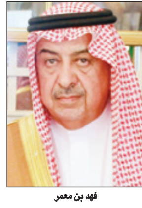
فهد بن معمر

الطائف - اسماعيل ابراهيم ■ رفع معالي محافظ الطائف فهد بن عبدالعزيز بن معمر التهاني لخادم الحرمين الشريفين الملك عبدالله بن عبدالعزيز آل سعود وسمو ولي عهده الأمين الأمير سلمان بن عبدالعزيز، وسمو ولي ولي العهد الأمير مقرن بن عبدالعزيز - حفظهم الله - بمناسبة إقرار الميزانية العامة للدولة للعام المالي الجديد. وأبان محافظ الطائف أن الميزانية اهتمت بما يهم المواطن في الدرجة الأولى كاللعليم والصحة والخدمات، وهذا يدن حكومتنا الرشيدة في اهتمامها بالمواطنين، ووصف ابن معمر ميزانية هذا العام بأنها امتداد لميزانيات الخير التي حققت أرقاماً قياسية وإنجازات على الأضعدة الاقتصادية والاجتماعية كافة، لافتاً النظر إلى أن الميزانية حملت في طياتها إشارات قوية تؤكد اهتمام القيادة باستمرار التنمية في مختلف مجالاتها، كما أكدت مجدداً الحرص على تعزيز الجانب الاجتماعي والاهتمام بالتنمية البشرية وإحداث التنمية الشاملة والمتوازنة بين مختلف المناطق والارتقاء بمستوى الخدمات المختلفة رغم ما تمر به أسعار النفط من عدم استقرار.. وسأل محافظ الطائف الله العلي القدير أن يديم علينا الأمن والأمان والنعمة وأن يرزقنا شركها واستغلالها في خير البلاد والمواطنين في ظل