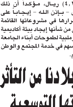
د. أسامة بن صاقل طيب

الرياض - واس ■ قال مدير جامعة الملك عبدالعزيز الدكتور أسامة بن صادق طيب، إن إقرار الميزانية العامة للدولة يؤكد سعي حكومتنا الرشيدة بقيادة خادم الحرمين الشريفين الملك عبدالله بن عبدالعزيز آل سعود، وسمو ولي عهده الأمين، وسمو ولي ولي العهد - حفظهم الله - على مواصلة التوسع في دعم المشروعات التنموية التي تؤسس لأقتصاد وطني قوي قائم على أساس متين قوامه الإرادة والإصرار من أجل تحقيق الأمن الفكري والاقتصادي والاجتماعي، على الرغم من الظروف الاقتصادية الصعبة التي يمر بها العالم.