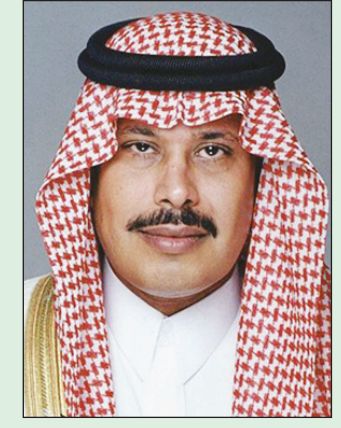
الأمير مشاري بن سعود

والشاملة، ولاشك أن الميزانية التي خصصت لمشاريع حيوية تنموية لعل أهمها التعليم والصحة والطرق والشؤون الاجتماعية وغيرها دليل على حرص ولاة الأمر - حفظهم الله - على توفير كل الاحتياجات لأبناء هذه البلاد، مؤكداً سموه أن هذه الميزانية ستكون داعماً رئيسياً للمشاريع في مختلف مناطق المملكة ومنها منطقة الباحة.