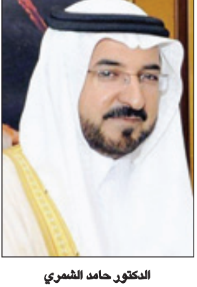
الدكتور حامد الشمري

الباحة - مشعل السوادي ■ أشاد وكيل إمارة منطقة الباحة الدكتور حامد بن صالح الشمري، بما حملته الميزانية العامة للدولة للعام المالي الجديد ١٤٣٦-١٤٣٧هـ من خير تحقيقاً لتطلعات ورغبات المواطنين في شتى المجالات. وقال الشمري بهذه المناسبة: إن خادم الحرمين الشريفين الملك عبدالله بن عبدالعزيز آل سعود - حفظه الله - حرص على أن تكون هذه الميزانية في مستوى تطلعات المواطنين وتحقق رغباتهم من مشاريع الخير والنماء لتواصل المسيرة المباركة لهذه البلاد العطاء. وأضاف أنه مما لا شك فيه أن ميزانية هذا العام ستكون رافداً مهماً لاستكمال وإنشاء مشاريع جديدة في جميع مناطق المملكة ومنها منطقة الباحة التي حظيت بمشاريع حيوية في شتى المجالات والتي ستسهم في تحقيق الراحة والرفاهية للمواطن، سائلاً الله أن يحفظ لهذه البلاد قادتتها وأن يديم عليها أمنها واستقرارها.