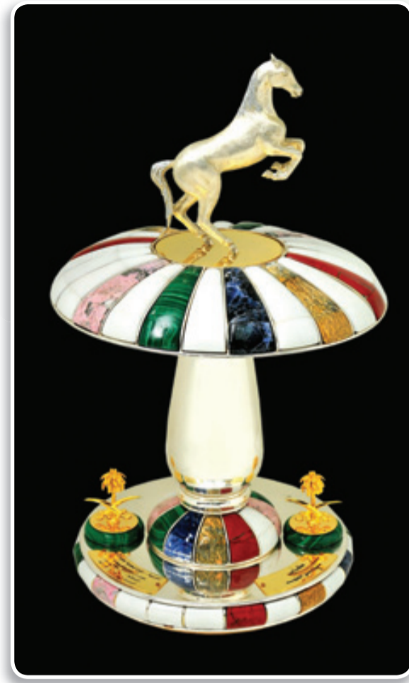
النسخة الجديدة لكأس سمو ولي العهد التي ستقدم لبطال اليوم