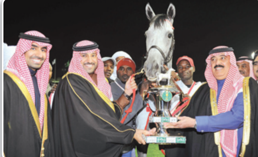
الأمير متعب بن عبدالله مع أمير الرياض تركي بن عبدالله وبينهما البطل صيرور في إحدى البطولات السابقة

لحرص حكومتنا الرشيدة -أيدها الله- على إبراز هذه الرياضة الاصلية مرحبا بتثريته سمو