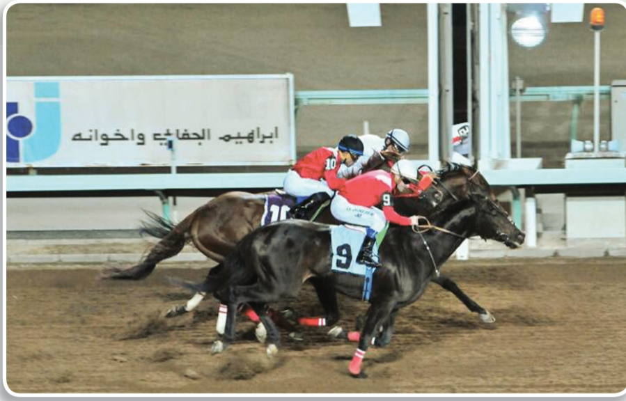
البطل الأحمر (جدل) في سباقه المثير على كأس الوفاء الشهر الماضي والمرشح للفوز بكأس الإنتاج اليوم