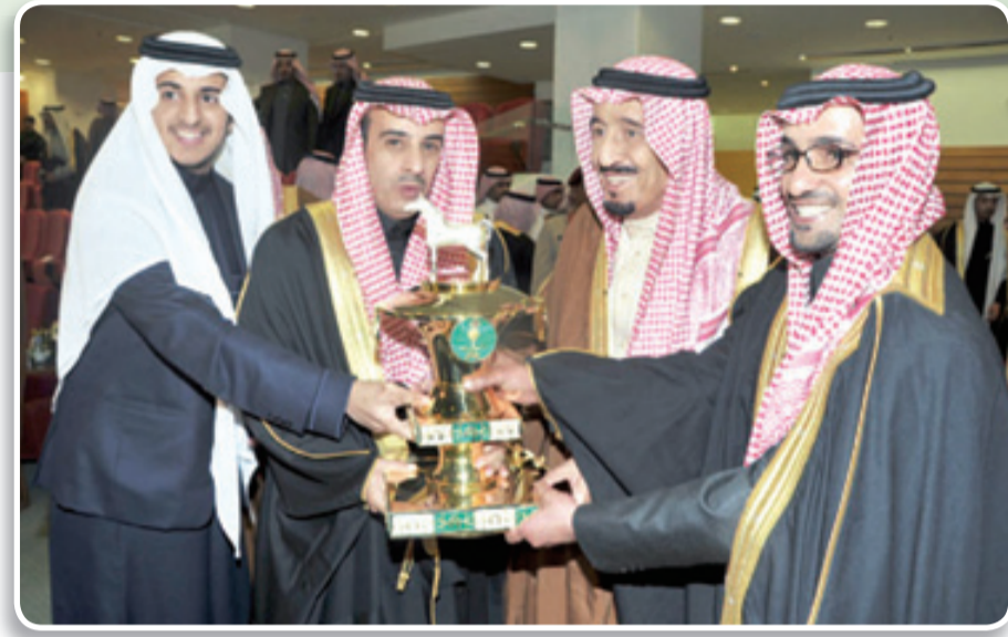
الأمير سلمان خلال رعاية كأس سموه للمستورد في الموسم الماضي الذي توج به البطل (سنجلات) لنزار أبو الجدايل

توج بلقب كأس ولي العهد للمستورد في الموسم الماضي بالبطال (سنجلات) الذي يدخل الميدان مع الخيال ديكنز دويل للدفاع عن لقبه بمؤازره زميله (قون دوتش) . وهناك (بيركسيا) لاسطبل شواهد و(ورلد لي) للشريف هزاع العبدلي و( فيونق ) لفهد الفوزاني و(هونورد) و(سمر فري) لمشعل المطيري و(بنك اون مي) لفهد المطيري واخيرا المالك الجديد عبدالاله عبدالعزيز الموسى بالثنائي (ونيد) و(كنج اوف ذا دانيس) . ترشيحات المراقبين لهذا الشوط وضعت الابيض (وطني) مرشحا اول يليه حامل اللقب (سنجلات) ثم الاحمر (فلا سولو) والمفاجاه جديد الاحمر (نوتيلوس) .