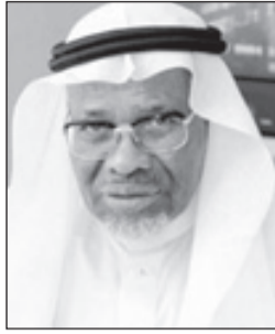
د. أحمد محمد علي

جدة - واس ■ رفع رئيس مجموعة البنك الإسلامي للتنمية الدكتور أحمد محمد علي، خالص التعازي وصادق المواساة لخادم الحرمين الشريفين الملك سلمان بن عبدالعزيز آل سعود، وصاحب السمو الملكي الأمير مقرن بن عبدالعزيز آل سعود ولي العهد نائب رئيس مجلس الوزراء، وصاحب السمو الملكي الأمير محمد بن نايف بن عبدالعزيز ولي ولي العهد النائب الثاني لرئيس مجلس الوزراء وزير الداخلية - وإلى الأسرة المالكة والشعب السعودي في وفاة الملك عبدالله بن عبدالعزيز - رحمه الله.