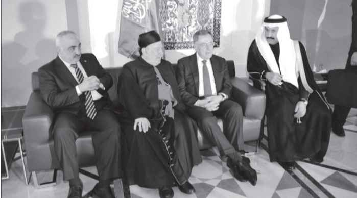
السفير عسيري يستقبل المعزير

بيروت - و.ا.س ■ واصلت سفارة خادم الحرمين الشريفين في لبنان أمس استقبال المعزير بوفاة خادم الحرمين الشريفين الملك عبدالله بن عبدالعزيز آل سعود - رحمه الله - حيث كان في استقبالهم السفير علي بن سعيد عوض عسيري ومسديرو المكاتب السعودية وأعضاء العثة الدبلوماسية، وذلك في قاعة الرئيس رفيق الحريري للاجتماعات بجامع محمد الأمين بوسط بيروت. وكان من بين المعزيرين الذين توافدوا لتقديم العزاء رئيس مجلس الوزراء اللبناني تمام سلام ورئيس الجمهورية اللبنانية السابق ميشال سليمان ورئيس مجلس الوزراء اللبناني الأسبق رئيس كتلة المستقبل النيابية فؤاد السنيرة