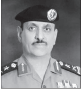
الفريق عثمان المحرج

الرياض - مناحي الشيباني ■ بعبارة الحزن والأسى نعى مدير الأمن العام الفريق عثمان بن ناصر المحرج فقيد الأمة العربية والإسلامية الملك عبدالله بن عبدالعزيز آل سعود - رحمه الله - قائلاً في تصريح: إننا اليوم وبقلوب مؤمنة بقضاء المولى وقدره نوع ويودع الوطن فقيدته الغالي الملك عبدالله بن عبدالعزيز - رحمه الله - الذي فجع أبناء الوطن والمقيمين على أرضه بفقدته ورافقه صبيحة يوم فضيل مبارك، غادرتنا والقلوب حزينة على فرقه والعيون تدمع للوعة فقده، غابرتنا بعد مسيرة نماء ورخاء مباركة شهدتها المملكة خلال فترة حكمه كان فيها نعم القائد والمليك والوالد الحكيم العطوف الحريص على دينه ووطنه المهلب لمطموحات