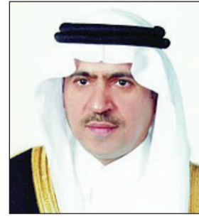
د. أحمد السالم

ولي ولي العهد والنائب الثاني لرئيس مجلس الوزراء وزير الداخلية رئيس اللجنة الوطنية لمكافحة المخدرات الدكتور أحمد بن محمد السالم، أن أفة المخدرات لا تقل خطورة عن ظاهرة الإرهاب، وأن استهداف شبابنا ومجتمعنا بالمخدرات يأتي ضمن مخطط لتعطيل قدراتهم وتمزيق نسيجهم المتماسك والمبني على قيمنا وعاداتنا الإسلامية. وأكد أننا جميعاً مطالبون بمكافحتها ووقاية أبناء الوطن من مخاطرها انطلاقاً من واجبنا الديني والوطني والإنساني. وأضاف: تحظى هذه القضية بمتابعة شخصية واهتمام بالغ من صاحب السمو الملكي