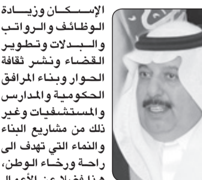
عبدالحسن بن عبدالعزيز التويجري

أما على الصعيد الخارجي عربياً وإسلامياً ودولياً فإن المملكة في عهده - يحفظه الله - سجلت قيادة مشرفة في دعم القضية الفلسطينية والدفاع عن الإسلام وتبيان سمو رسالته وتبني مواقف السلام والاعتدال ومحاربة الإرهاب والتطرف وقيادة الحوار العالمي بين أتباع الأديان والثقافات والإسهام في تحقيق التوازن الاقتصادي وتكافؤ الفرص وتوفير فرص العيش الكريم للشعوب. وهي أعمال ومبادرات أسهمت على جانب ما يحظى به -رعاه الله- من سمات قيادية متميزة وصفات نبيلة في إبراز مكانته كقائد عالمي كما أسهمت في حفظ مكانة المملكة كدولة رائدة وسوغت دخولها إلى نادي قمة العشرين لتكون من صناعات القرار الاقتصادي العالمي.