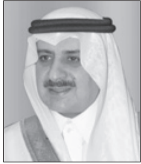
الأمير فهد بن سلطان

بداً مسيرة هذه البلاد المباركة فهي بدأت برجل عظيم، الملك عبدالعزيز بن عبدالرحمن آل سعود - رحمه الله - وشاركه المسيرة رجال المملكة من مختلف المناطق، منذ أن بدأ مسيرته عند دخوله عاصمة المملكة الرياض وبدأت المسيرة المباركة، حيث بذل فيها الغالي والنفيس ولم يبخل أبناء المملكة بأي شيء سواء من دمائهم وأرواحهم وأبنائهم ومالهم إلى أن حققوا أهم وأعظم وحدة عرفها تاريخ المنطقة على الإطلاق.