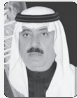
متعب بن عبدالله بن عبدالعزيز وزير الحرس الوطني

والتقدم في جميع المجالات. إن التأمّل في مسيرة جلالته الملك عبدالعزيز، القارئ لتاريخه، المسترجع لما قام به من أعمال عظيمة يدرك أن البراءة عز وجل قد هيا لهذا البلاد رجالاً ما أبنائها حمل راية التوحيد وسعى لجمع الشتات داعياً إلى التآخي والتلاحم وقاد هذه البلاد المباركة لتأخذ مكانتها الريادية كونها بلاد الحرمين الشريفين ومهوى أفئدة المسلمين في كل بقاع العالم، ويفضل الله وتوفيقه تم له ما أراد، فانطلقت بلادنا نحو الاستقرار والأمان على يد جلالته الملك عبدالعزيز - طيب الله ثراه - حتى أصبحت مثالا يحتذى في وحدتها السياسية وترباط نسجها الوطني الذي يزداد تماسكاً وقوة يوماً بعد يوم.