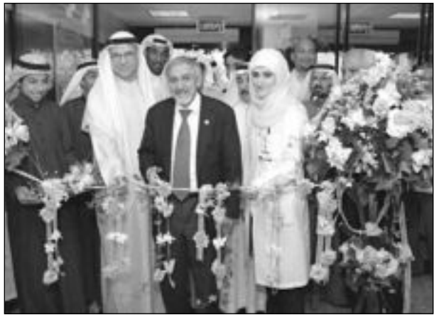
الساير مفتتحاً مركز الصباحية الشرقي الصحي