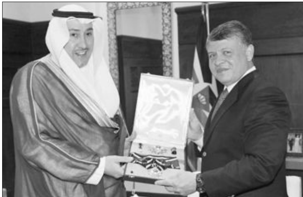
الملك عبدالله مقيماً وسام الاستقلال لفيصل الحمود

كرم العاهل الأردني الملك عبدالله الثاني السفير الشيخ فيصل الحمود المالك الصباح، وقلده وسام الاستقلال من الدرجة الأولى، مثنياً على الجهود التي بذلها خلال عمله سفيراً للكويت في الأردن. وأشار إلى الدور الفعال للشخص فيصل الحمود في تفعيل وتعزيز الروابط الثنائية الأمر الذي كان له آثاره الطبية على العلاقات بين البلدين الشقيقين. وتطرق المعاهل الأردني إلى نشاطات الشيخ فيصل واجتهاداته واسلوبه غير التقليدي في العمل الدبلوماسي. من ناحيته، أكد الشيخ فيصل على اعترازه بوسام