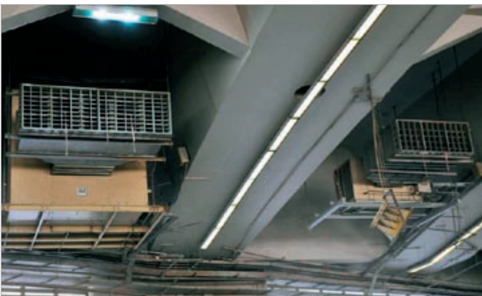
تكييفات صحراوية في الخيام

الذي سيسهم في خفض درجة الحرارة من 29 إلى 24 درجة مئوية حسب درجة الحرارة الخارجية، وقد تم تركيب 360 جهاز تكييف لتبريد الأجواء للحجيج في منشآت الجمرات.