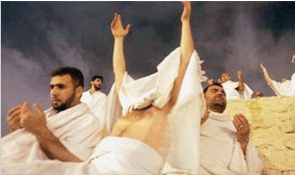
حجاج بريطانيون يؤدون المناسك

مرة واحدة في العمر، والعديد من اللصوص أيضاً ينتهزون المناسبة نفسها لسرقة هذا المال والحلم العظيم الذي كان سيحققه لهم». ونقلت الفضائية عن أصف صادق قوله إنه اشترى أسهما في شقة لسكنه وسكن أسرته في مكة بمبلغ 9 آلاف جنيه (15,75 ألف دولار)، لكنه اكتشف أنها شقة وهمية لا وجود لها على الإطلاق، وقال: «الآن، كلما خطرت فكرة الحج يبالي أفكر أيضاً في مالي المسروق، الحج يجب أن يكون أسعد مناسبات الحياة، فصار تجربة مؤلمة».