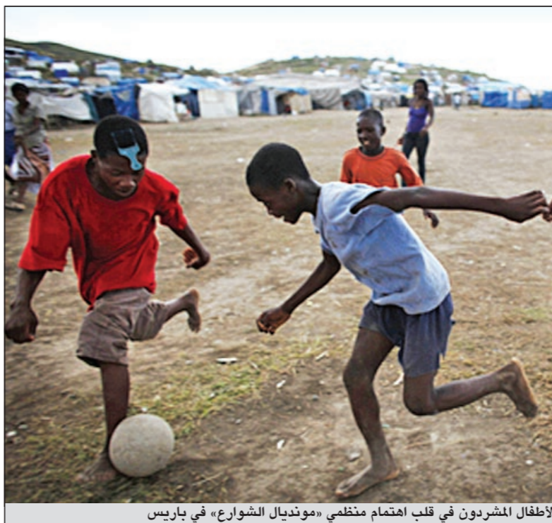
الأطفال المشردون في قلب اهتمام منظمي «مونديال الشوارع» في باريس