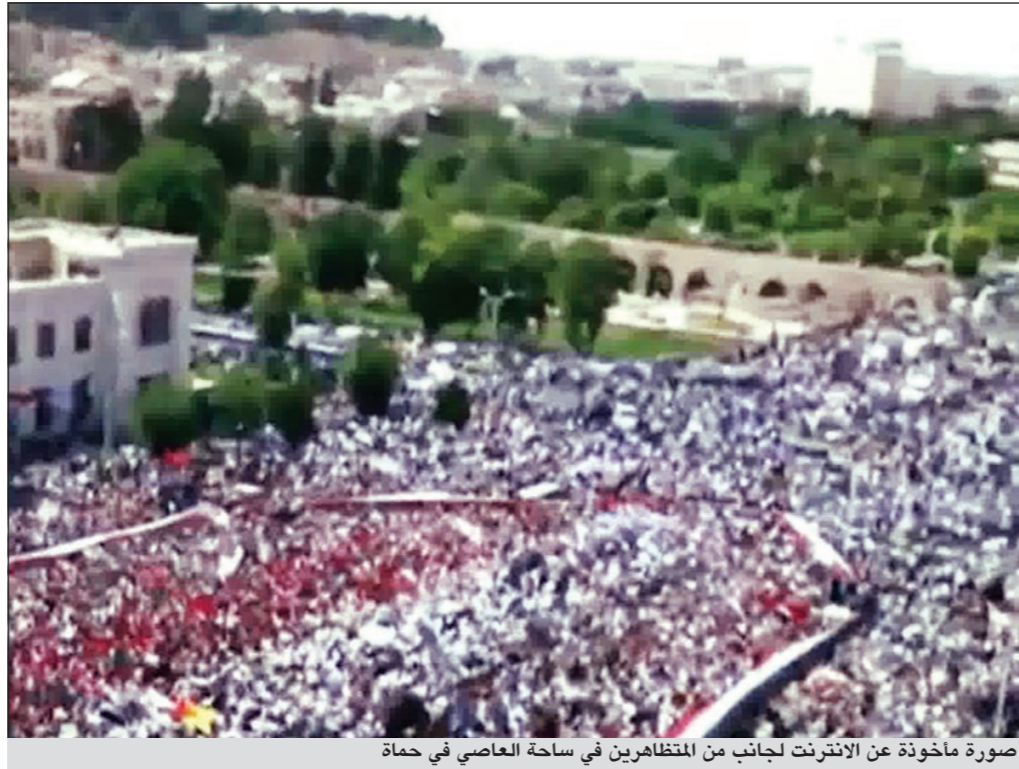
صورة مأخوذة عن الإنترنت لجانب من المظاهرين في ساحة العاصي في حماة