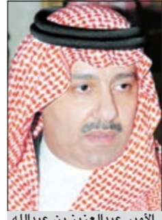
الأمير عبدالعزيز بن عبدالله

الرياض - أ.ف.ب. عين خادم الحرمين الشريفين الملك عبدالله بن عبدالعزيز نجله الأمير عبدالعزيز بن عبدالله نائباً لوزير الخارجية بمرتبة وزير، حسبما أفادت وكالة الأنباء السعودية الرسمية أمس. ونص الأمر الملكي الذي بثته الوكالة على الأمير عبدالعزيز بن عبدالله بن عبدالعزيز نائباً لوزير الخارجية بمرتبة وزير. وكان الأمير عبدالعزيز بن عبدالله عمل موفداً خاصاً لوالده في قضايا إقليمية مهمة وخصوصاً في ملف العلاقات مع سورية.