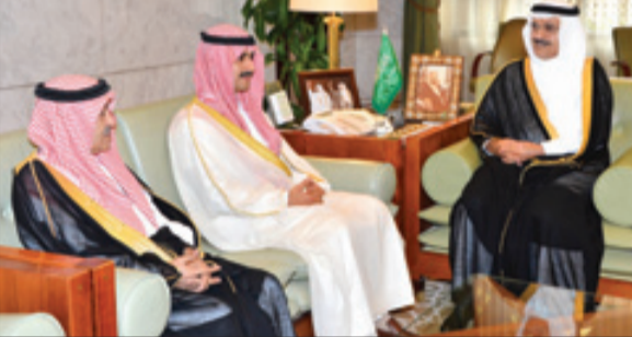
الأمير خالد بن بندر يستقبل رئيس مكافحة الفساد بدولة الكويت