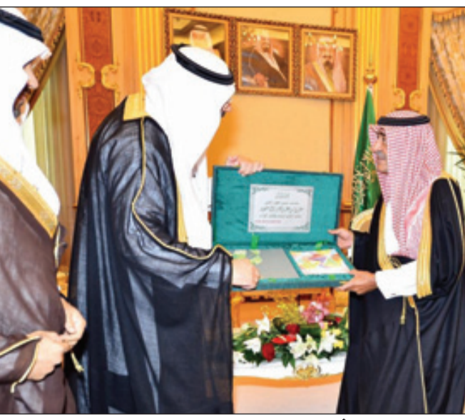
الأمير مقرن يستقبل مدير بنك التسليف والادخار

استقبل صاحب السمو الملكي الأمير مقرن بن عبدالعزيز آل سعود النائب الثاني لرئيس مجلس الوزراء والمستشار والمبعوث الخاص لخادم الحرمين الشريفين -حفظه الله- في مكتبه بقصر اليمامة بالرياض أمس مدير عام البنك السعودي للتسليف والادخار الدكتور إبراهيم عبدالعزيز الحنيشل الذي سلم سموه التقرير السنوي للبنك للعام الهجري الماضي، واستمع سموه خلال الاستقبال لشرح مفصل من الدكتور الحنيشل عن البرامج التي قدمها البنك خلال الفترة الماضية، وأبرز البرامج التي يستعد البنك لتقديمها خلال الفترة القادمة، ونوه