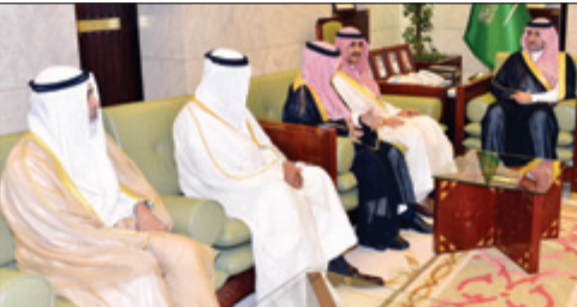
الأمير تركي بن عبدالله يستقبل رئيس مكافحة الفساد بالكويت