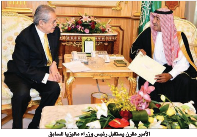
الأمير مقرن يستقبل رئيس وزراء ماليزيا السابق

استقبل صاحب السمو الملكي الأمير مقرن بن عبدالعزيز آل سعود النائب الثاني لرئيس مجلس الوزراء والمستشار والمبعوث الخاص لخادم الحرمين الشريفين -حفظه الله- في مكتبه بقصر اليمامة في الرياض أمس رئيس وزراء ماليزيا السابق عبدالله بن أحمد بدوي المبعوث الخاص لدولة