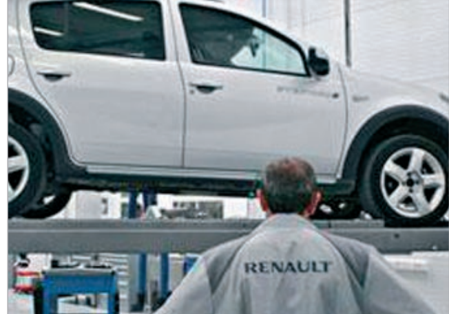
الشركة تعد لطرز كهربائية جديدة

داقوس - سي.ان.ان: استبعد كارلوس غصن، رئيس شركة رينو الفرنسية لصناعة السيارات، أن تؤثر قضية التجسس التي جرى الكشف عنها مؤخرا على الطرز الكهربائية الحديثة التي تصممها الشركة على الإنتاج الفعلي للسيارات، وكشف أن أسلوب التجسس وحجمه شكل «صدمة له».