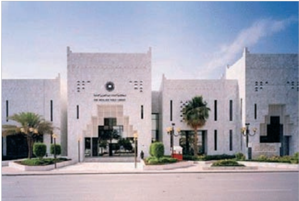
مكتبة الملك عبدالعزيز في الرياض

الرياض - يو.بي.أي: أعلنت مكتبة الملك عبدالعزيز العامة أنها تحتوي على 32 ألف كتاب نادر ضمن مقتنياتها منها أكثر من 3200 كتاب باللغات الأوروبية الخاصة للمستشرق الأميركي جورج رنتس.