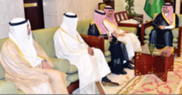
الأمير تركي بن عبدالله يستقبل رئيس مكافحة الفساد بالكويت

الرياض - واس استقبل صاحب السمو الملكي الأمير تركي بن عبدالله بن عبدالعزيز نائب أمير منطقة الرياض في مكتبه بقصر الحكم أمس رئيس الهيئة العامة لمكافحة الفساد بدولة الكويت الأستاذ عبدالرحمن بن نمش النمش والوفد المرافق له، وجرى خلال الاستقبال مناقشة الموضوعات المتعلقة بحماية النزاهة ومكافحة الفساد. حضر الاستقبال رئيس الهيئة الوطنية لمكافحة الفساد الأستاذ محمد بن عبدالله الشريف، فيما حضره من الجانب الكويتي الشيخ ثامر بن جابر الأحمد الصباح سفير دولة الكويت لدى المملكة.