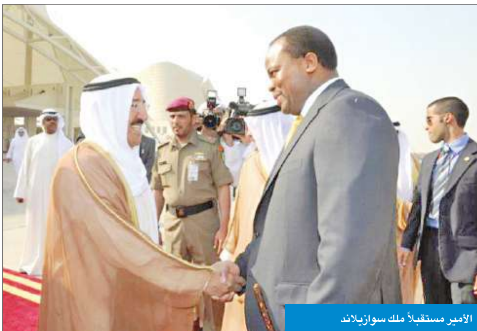
الأمير مستقبلاً ملك سوازيلاند

ويرافق الملك وفد رسمي يضم كلا من اصحاب السمو الملكي الامراء وصاحبة السمو الملكي