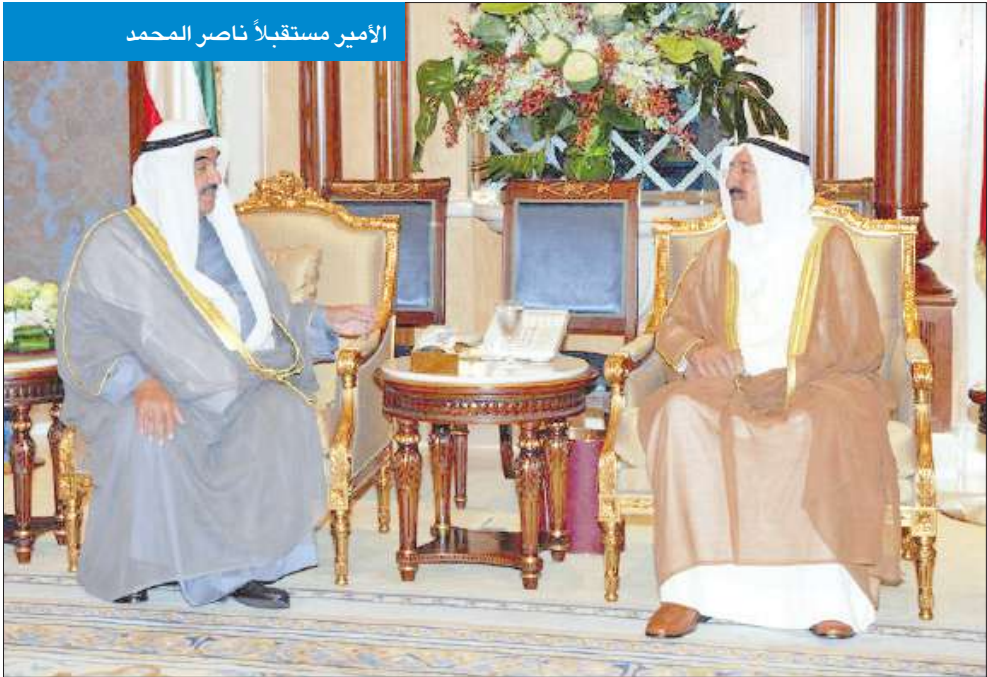
الأمير مستقبلاً ناصر المحمد

استقبل سمو امير البلاد الشيخ صباح الاحمد بقصر بيان أمس سمو ولي العهد الشيخ نواف الاحمد . كما استقبل سموه رئيس مجلس الأمانة جاسم الخرافي. واستقبل سموه الشيخ ناصر المحمد رئيس مجلس الوزراء