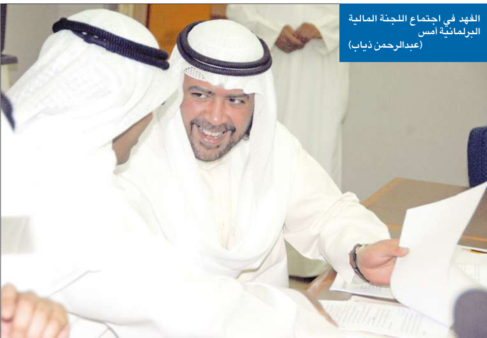
الفهد في اجتماع اللجنة المالية البرلمانية أمس (عبد الرحمن ذياب)

الفهد: مجلس الوزراء سيعيد طرح «المصفاة الرابعة»