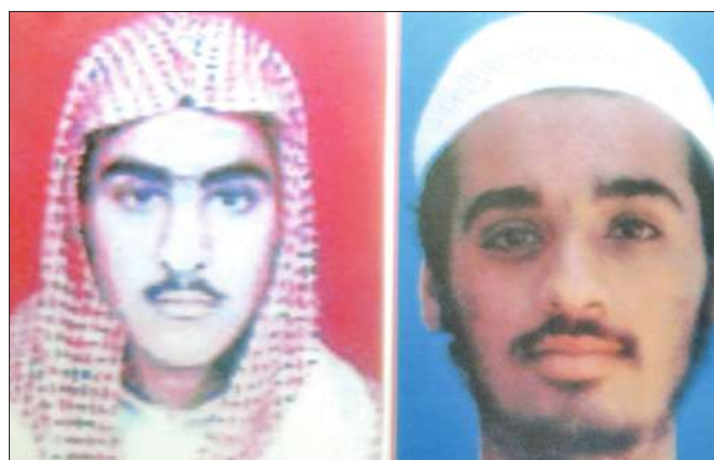
الشهري والحربي

العاهل السعودي يتلقى رسالة من الرئيس اليمني