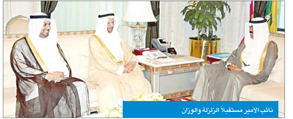
نائب الأمير مستقلاً الزئيلة والوزار

أكد وزير الدولة لشؤون الإسكان الشيخ أحمد الفهد أن مشاركة القطاع الخاص الجادة ستحدث نقلة نوعية وحضارية بسبب مرونة الإجراءات وتوفير الخبرات المتنوعة فيه، مما يسهل تنفيذ المشروعات برؤى حديثة وجريئة وسريعة ومتقنة.