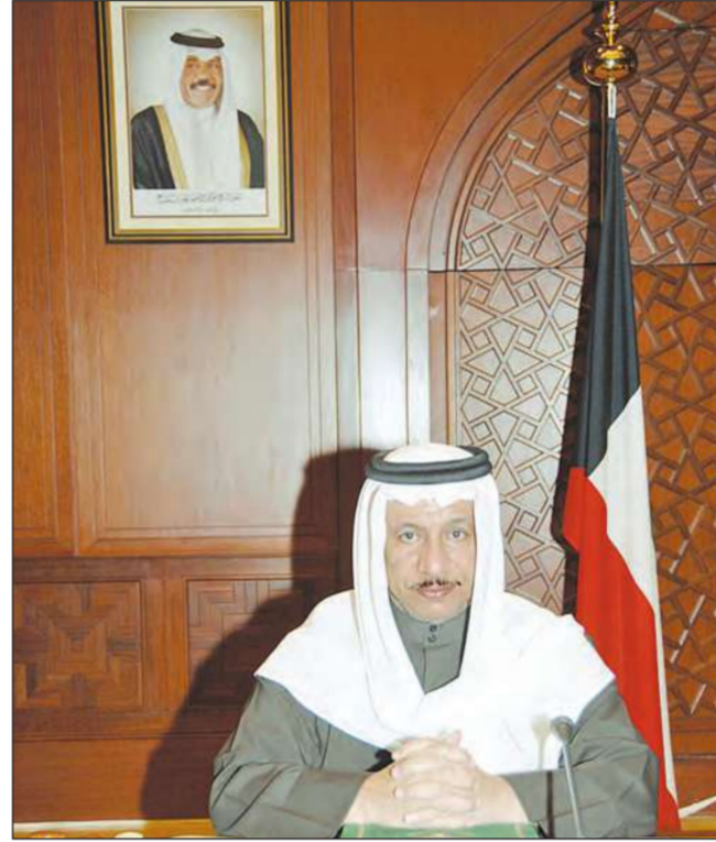
جابر المبارك مترنسا الجلسة

عقد مجلس الوزراء اجتماعه صباح امس في قصر السيف برئاسة رئيس مجلس الوزراء بالنيابة وزير الدفاع الشيخ جابر المبارك الحمد الصباح وذكر نائب رئيس مجلس الوزراء وزير الشؤون مجلس الوزراء فيصل الحجري في تصريح صحفي عقب الاجتماع أن المجلس استهل أعماله بالاستماع إلى شرح قدمه نائب رئيس مجلس الوزراء وزير الخارجية الشيخ الدكتور محمد الصباح حول نتائج الزيارة التي قام بها إلى كل من جمهورية أثيوبيا وجمهورية كينيا أخيراً والتي استهدفت بحث علاقات التعاون القائمة بين دولة الكويت وهاتين الجمهوريتين الصديقتين وسبل دعمها في مختلف الميادين لما فيه المصالح المشتركة بالإضافة إلى بحث القضايا الأخرى ذات الاهتمام المشترك، كما أحاط المجلس علماً بنتائج مشاركته في المؤتمر الدولي لمانحي السلطة الفلسطينية الذي عقد في باريس أخيراً والذي تم خلاله تقديم منحة من دولة الكويت بقيمة ثلاثمائة مليون دولار أميركي إلى الشعب الفلسطيني تمهيداً لإقامة الدولة الفلسطينية.