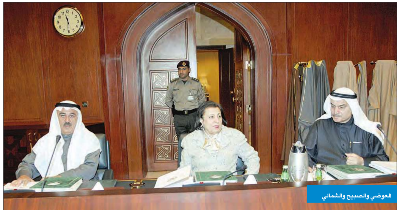
العوضي والصبيح والشمالي

شرح قدمه كل من وزير المالية مصطفى جاسم الشمالي ووزير التجارة والصناعة فلاح فهد الهاجري حول نتائج الزيارة التي