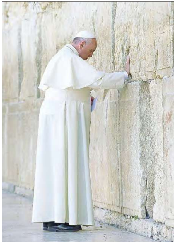
البابا أمام الحائط الغربي أمس

أنهى البابا فرنسيس أمس جولته في الأراضي المقدسة بزيارته لمدينة القدس، حيث زار أماكن مقدسة لدى المسلمين واليهود والمسيحيين، ودعا إلى حرية وصول المؤمنين إلى الأماكن المقدسة في القدس.