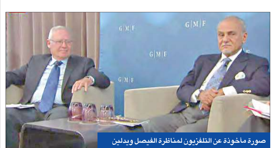
صورة مأخوذة عن التلفزيون لمناظرة الفيصل وبدلين

وقعت اتفاقية سلام مع إسرائيل، وهي مصر، تعرضت لقطعية كاملة قبل عقود، كما كان العرب يرفضون استخدام اسم إسرائيل نفسه، ويكتفون بوصفها بـ«الكيان المزعوم». وشكك الفيصل في صحة ما أدلى به الجنرال الإسرائيلي، مبيناً أن بلده هو الذي يرفض السير في