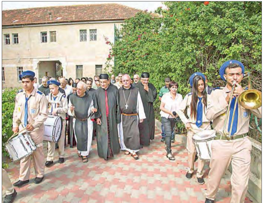
الراعي يزور دير اللطرون قرب القدس أمس بعد زيارته يافا

أنهى البابا فرنسيس أمس جولته في الأراضي المقدسة بزيارته لمدينة القدس، حيث زار أماكن مقدسة لدى المسلمين واليهود والمسيحيين، ودعا إلى حرية وصول المؤمنين إلى الأماكن المقدسة في القدس.