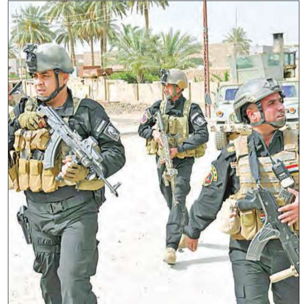
قوات الأمن العراقية تمسح أحد شوارع الرمادي بحثاً عن عناصر من تنظيم داعش أمس الأول

وشدد على أنه «في حال نجاح نوري المالكي في تولي رئاسة الوزراء للمرة الثالثة فإن خيار الكرد هو اللجوء إلى استفتاء شعبي في الإقليم بانجاح إعلان صيغة أخرى لعلاقتهم مع بغداد». إلى ذلك، برز موقف متميز لحزب الاتحاد الوطني الكردستاني، بزعامة رئيس الجمهورية جلال الطالباني، بشأن تصدير نفط كردستان عبر تركيا رغم رفض بغداد، إذ رأى الحزب أن هذه الخطوة ستزيد مشاكل الإقليم وتأتي